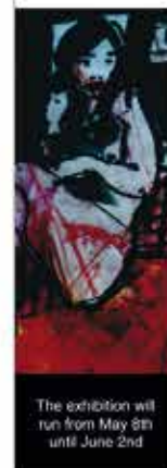
The exhibition will run from May 8th until June 2nd