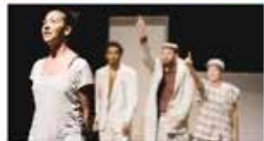
لقطة من العرض

إرسال | حفظ | طباعة | تصغير الخط | تكبير الخط