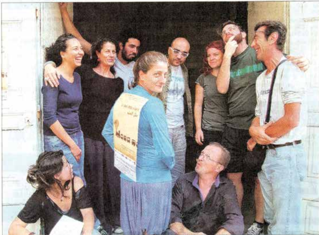
Les artistes français et libanais devant la Chapelle des Pénitents Blancs.