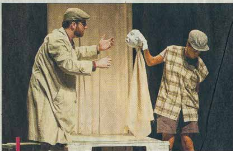
Cette production franco-libanaise prouve si il la fallait que l'art n'a pas de frontières.

Les artistes qui co-dirigent ce projet accordent une attention toute particulière au jeune public, jeune public qui occupe une place fondamentale,