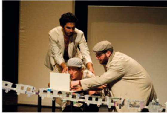
مشهد من إحدى مسرحيات (مثل الحلم)

أحياناً عن جربل سعادتها لوجودها في مسرح دوار الشمس ومواكبة هذا النشاط المتدفق والنوعي والجاذب، خصوصاً وأن الزحام للتلقيّة شكل عنصر دعم للمشروع، نفع من الجميع بخصوصية ما يقدمه المخرج ذكرو، متعاوناً هنا مع فريق تقني لبناني فرنسي مشترك، مما أعطى المسرحية نكهة مختلفة من هذه المواجهة في الجهد والرؤية وصولاً إلى الشكل النهائي: تمثيل، رهص، حركة، دمي، وفديو.