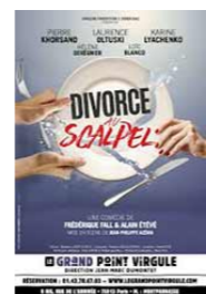
Divorce au scalpel GRAND POINT VIRGULE