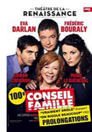
Conseil de famille RENAISSANCE