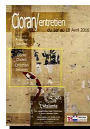
Coran / Entretien ATALANTE