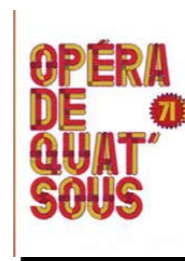
L'Opéra de quat'sous MALAKOFF