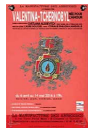
Valentina-Tchernobyl Née pour l'amour ABBESSES