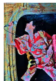
Le Cabaret stupéfiant HALL DE LA CHANSON