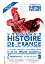
Une leçon d'histoire de France POCHE MONTPARNASSE