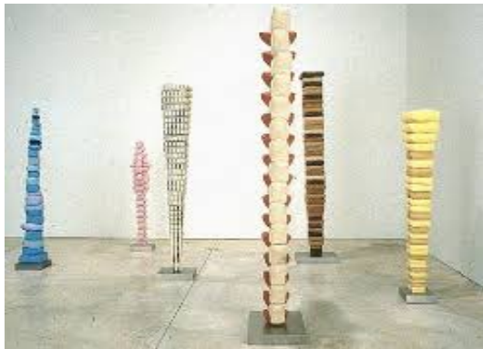
Totems exposés au Centre Pompidou en 2008.

- dans les années 1950, Louise Bourgeois utilise la forme du totem, forme américaine, spirituelle et en bois, pour manifester le chaos qui l'habite : le mal du pays, de la France. Ses amis et sa famille qui lui manquent.