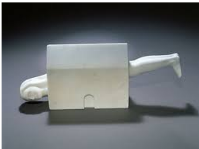
Femme-maison, exposition Centre Pompidou, 2008.

- dans les années 1970 au contraire, Louise Bourgeois atteint une notoriété internationale. Elle développe ses thèmes emblématiques : femme, procréation, sexualité, solitude. Plasticienne (recherches sur les formes) et sculptrice, Louise Bourgeois travaille sur des sculptures-installations, des objets et des matériaux divers, parfois même des objets personnels.