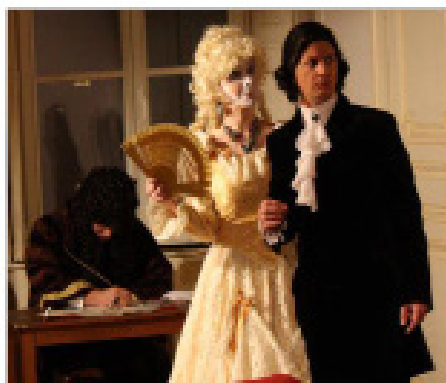
■ Un dispositif scénique original au château Miro-de-Graffigny.