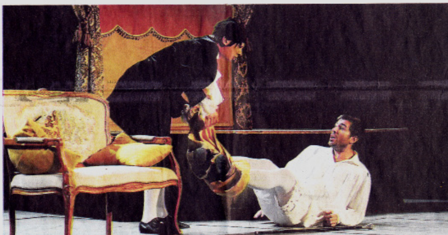
Pas le temps de s'ennuyer avec le rythme de la pièce. / Photo DDM, Jean-Luc Bibot.

H ier soir à l'Hôtel de Roland, la Compagnie « Les Enfants Terribles » donnait une représentation de son spectacle « Terriblement Molière ». Ce spectacle, inspiré de l'œuvre de Molière, trace une fresque savoureuse des pièces du dramaturge. Un voyage temporel qui