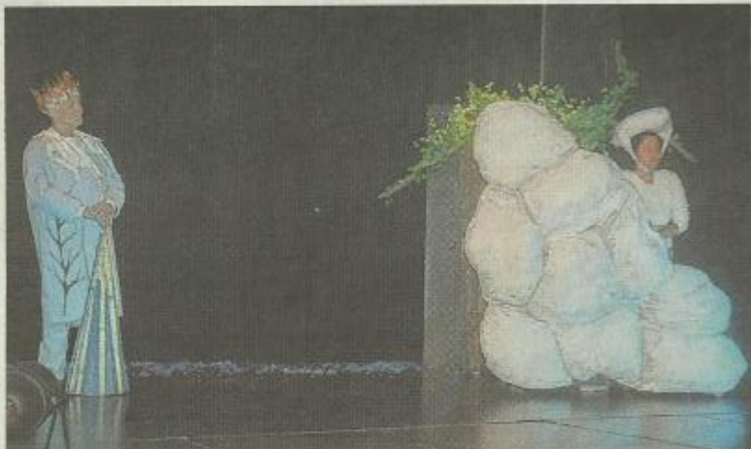
Un renne épris d'un nuage et Monsieur Hiver.