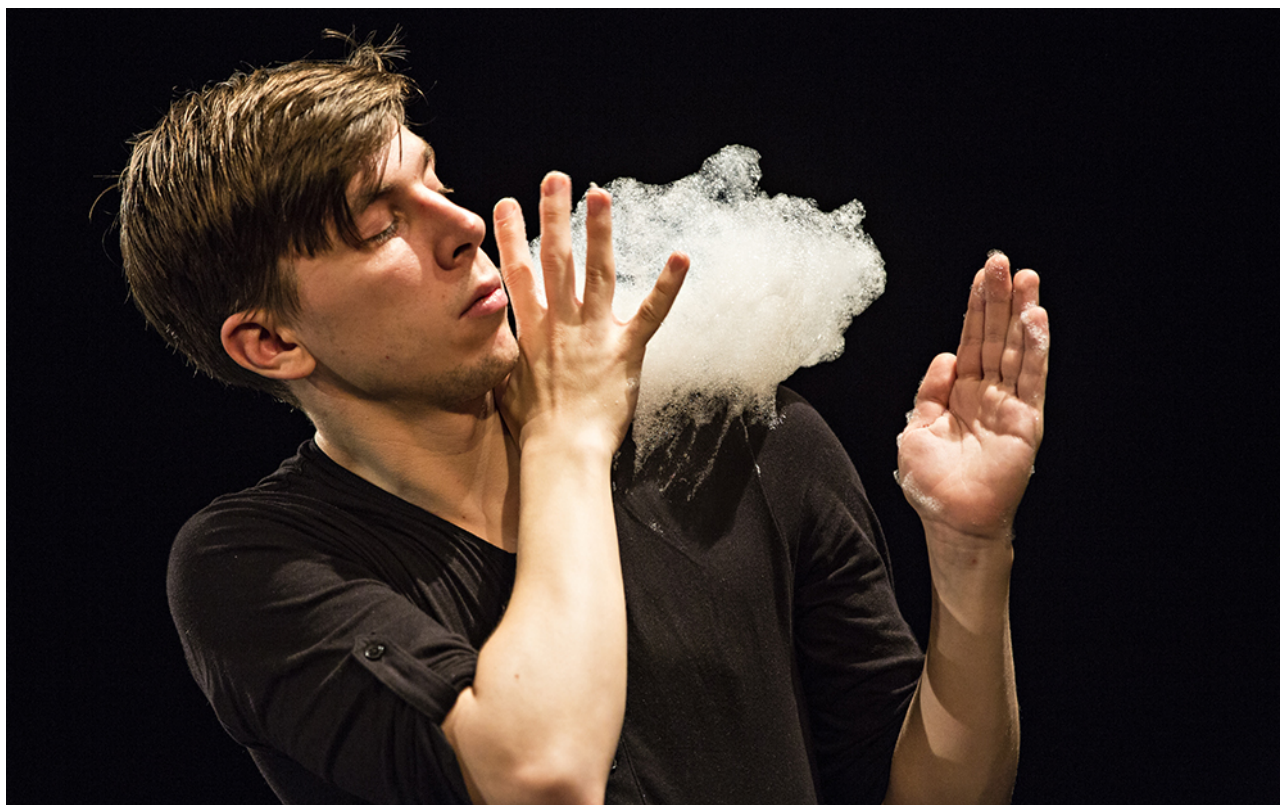
Répétitions à Clermont-Ferrand - Décembre 2016