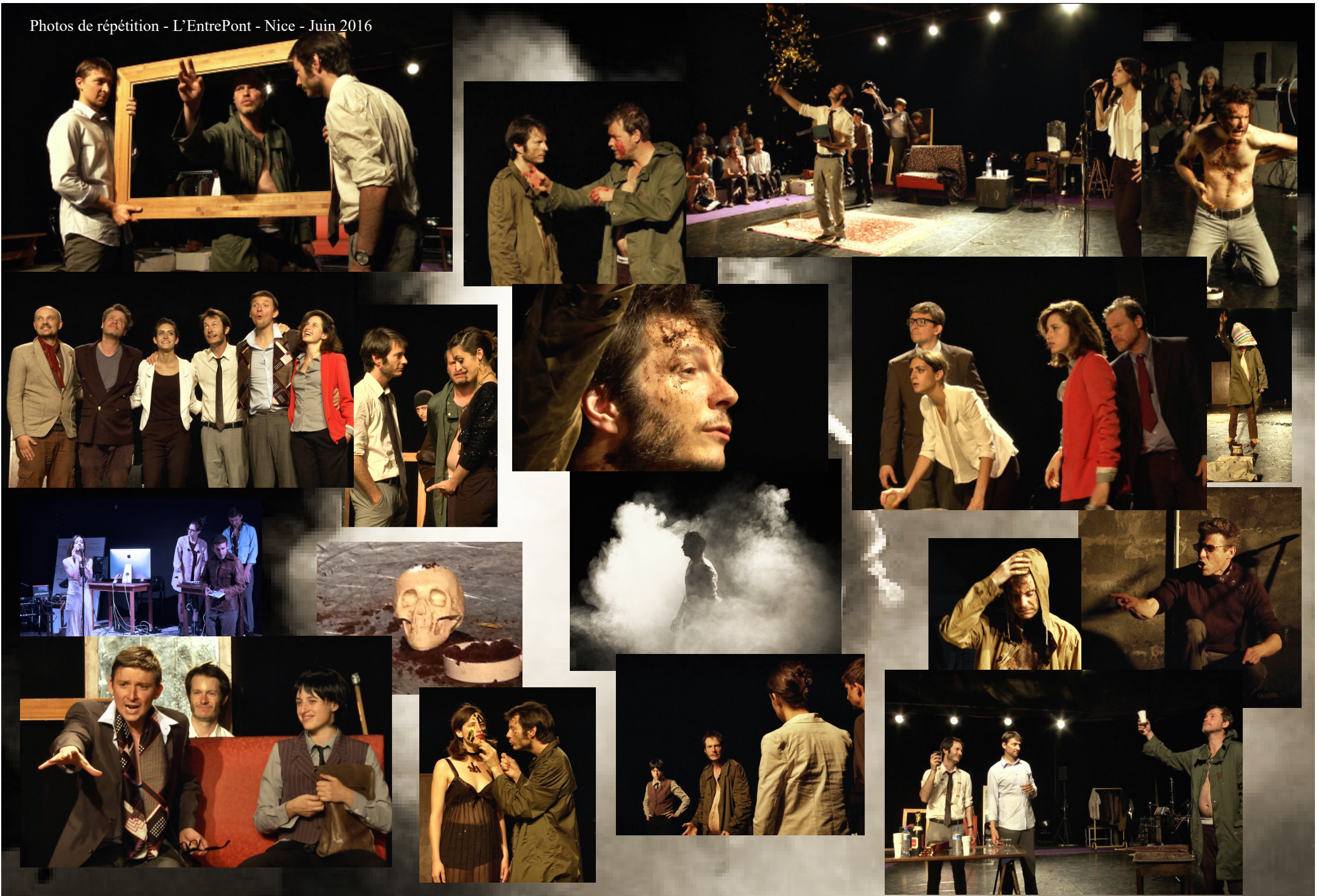
Photos de répétition - L'EntrePont - Nice - Juin 2016