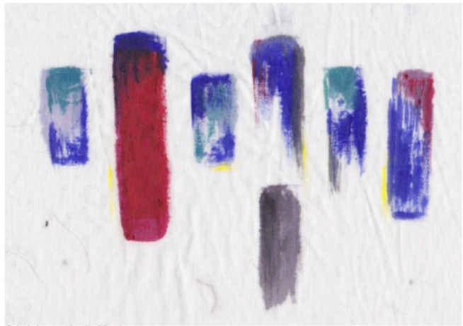
Échantillon de peinture et de sable, 1. Sécher