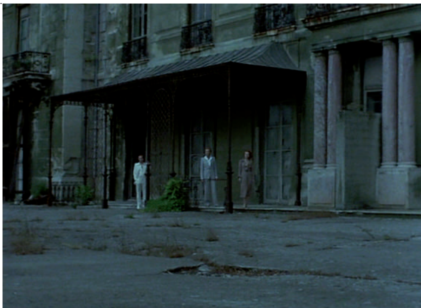
India Song de Marguerite Duras, 1975.