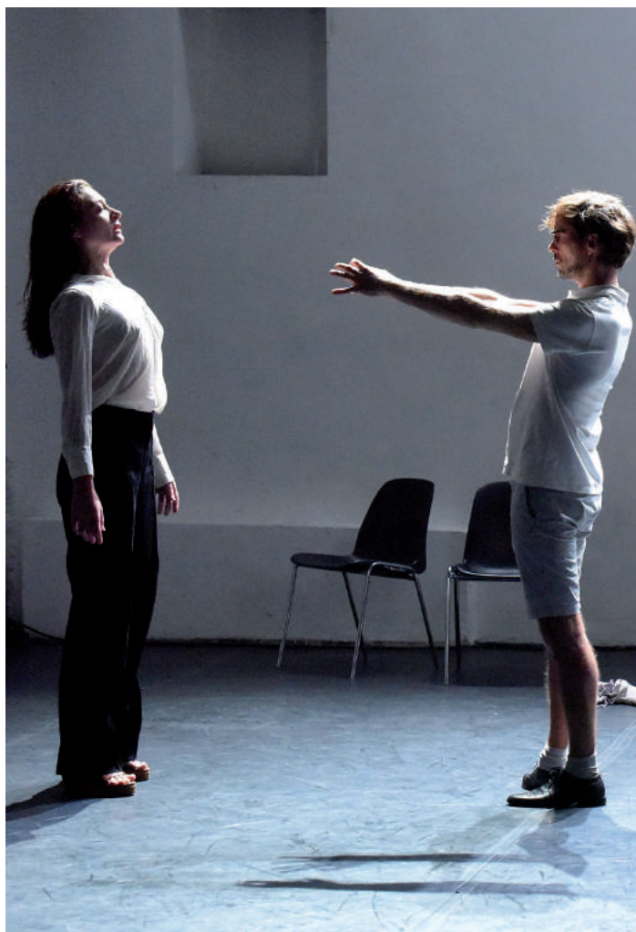
étape de travail novembre 2015

CRÉATION : LE STUDIO-THÉÂTRE DE VITRY > 3 AU 6 MARS 2017