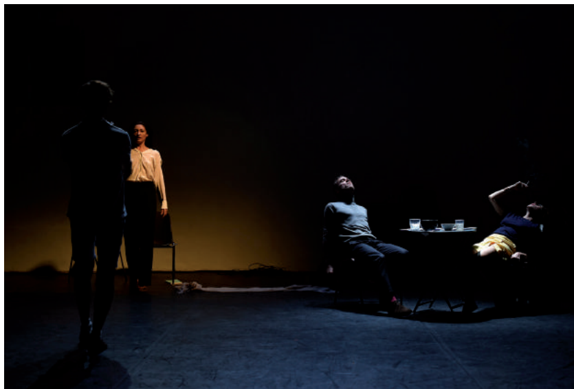
étape de travail, Festival Fragments, JTN, octobre 2015