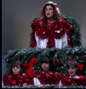
Toys, Barry Levinson