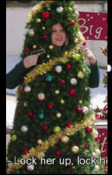
Inside Amy Schumer