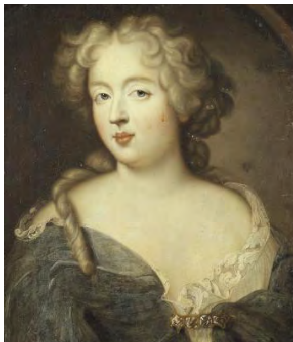
Madame de Montespan, Château de Versailles