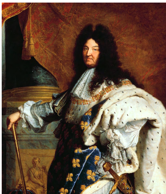
Portrait de Louis XIV en costume de sacre, de Hyacinthe Rigaud