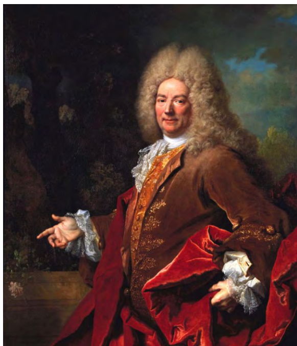
Louis-Henri de Pardailhan de Gondrin, Marquis de Montespan, par Nicolas de Largillière