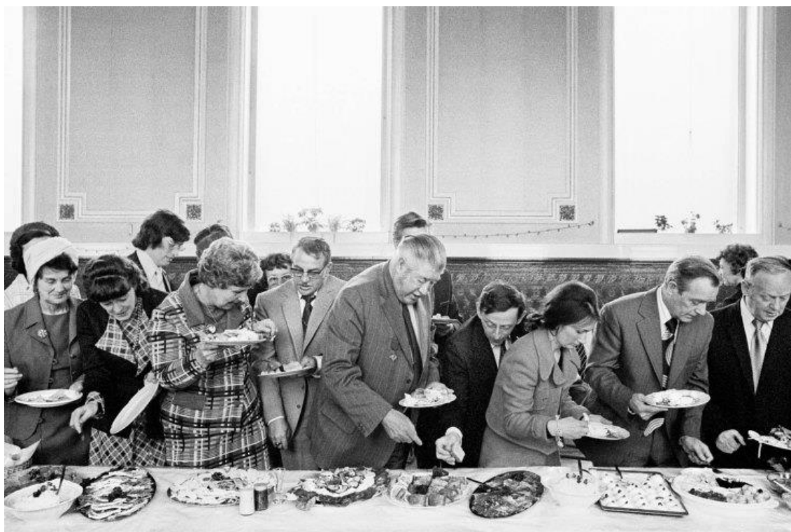
Martin Parr, photographie extraite du livre The Non-conformists, paru en 2013

Ce choix sera renforcé par l'absence totale d'accessoires sur le plateau (alors que la pièce suggère l'utilisation d'une bouteille, de verres, d'un flacon de parfum, etc.)