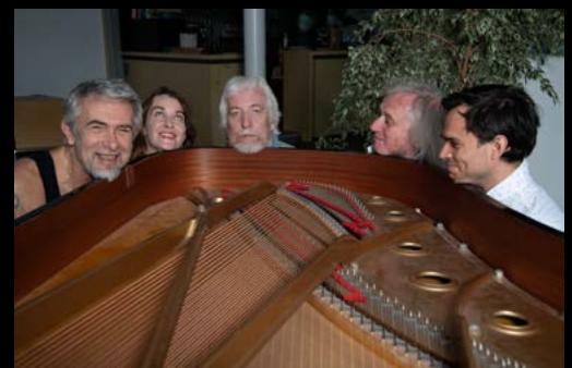
Photo des répétitions sans costumes ni décors