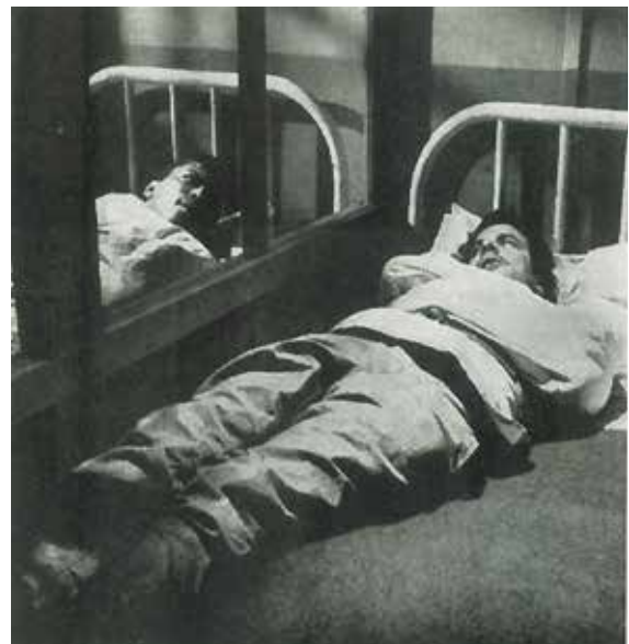
photographies extraites du film Shock Corridor de Samuel Fuller