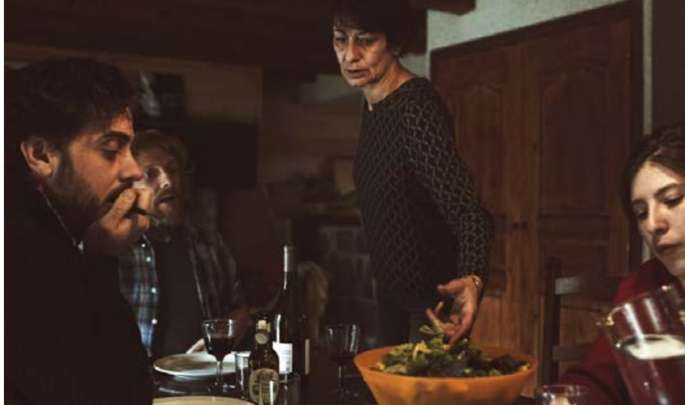
Répétition ANA

De très nombreux films sont des adaptations d'œuvres littéraires ou dramatiques. C'est beaucoup plus rare dans l'autre sens.