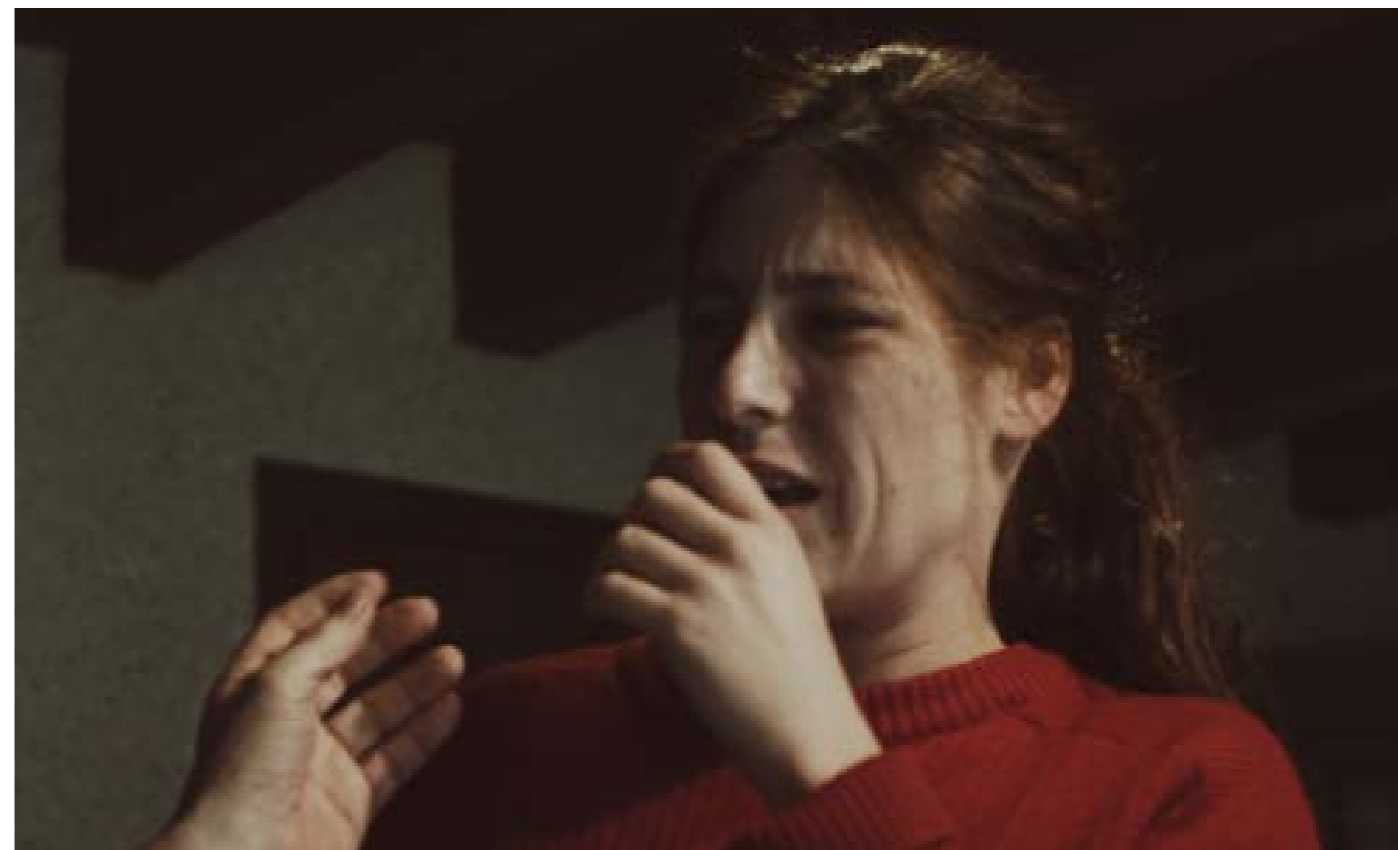
Répétition ANA - © Florian Bardet

Et l'émotion est très souvent là, toujours brutale, inattendue, fulgurante. Comme dans la vie.