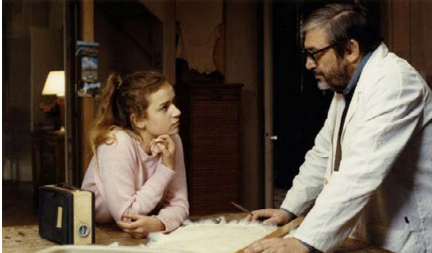
A nos Amours, 1983

Suzanne a quinze ans. En vacances sur la Côte d'Azur, elle repousse Luc, le jeune homme qui est amoureux d'elle, puis se donne à un Américain inconnu sur la plage. De retour à Paris, elle multiplie les aventures amoureuses. Ses parents se séparent. Son père quitte la maison. Elle doit faire face à l'hostilité de sa mère et de son frère. Son mariage se solde par un échec. Après avoir revu son père, elle part avec un amant aux États-Unis.