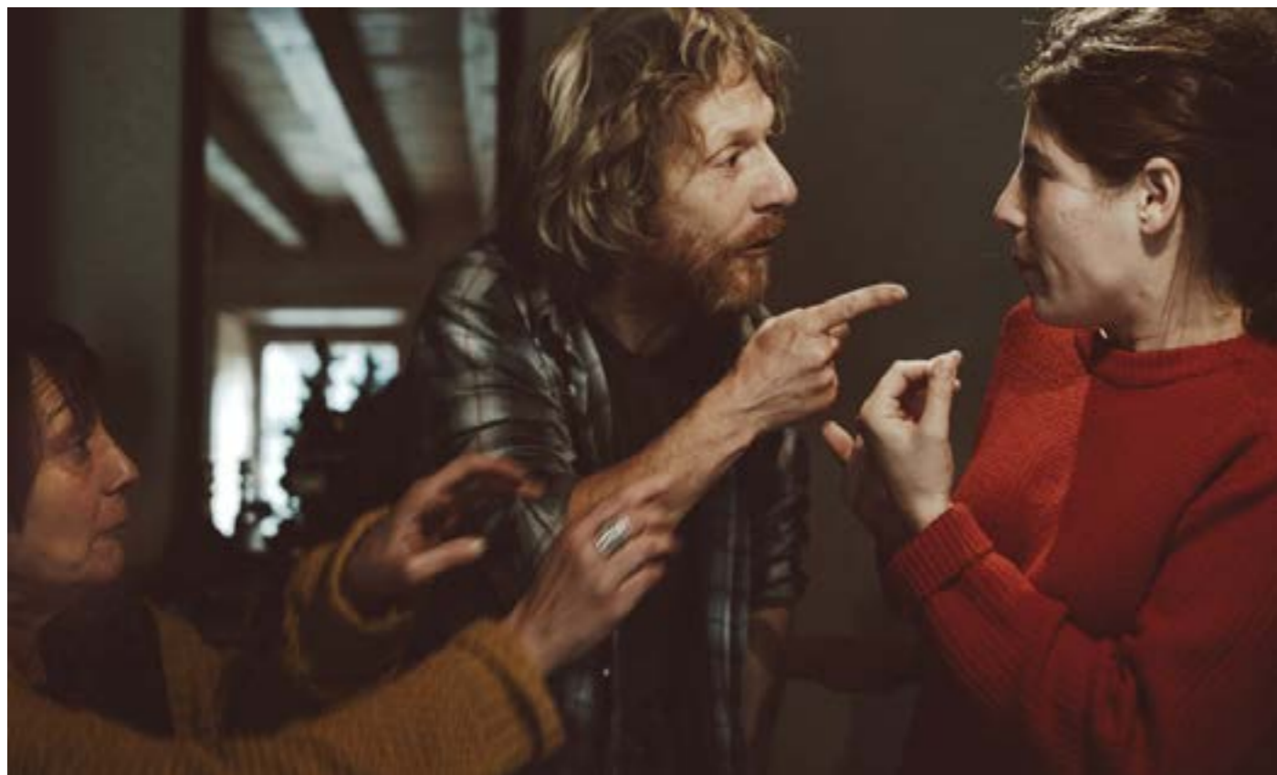
Répétition ANA

D comme Depardieu , tant le corps de Gérard Depardieu irradie dans son cinéma.