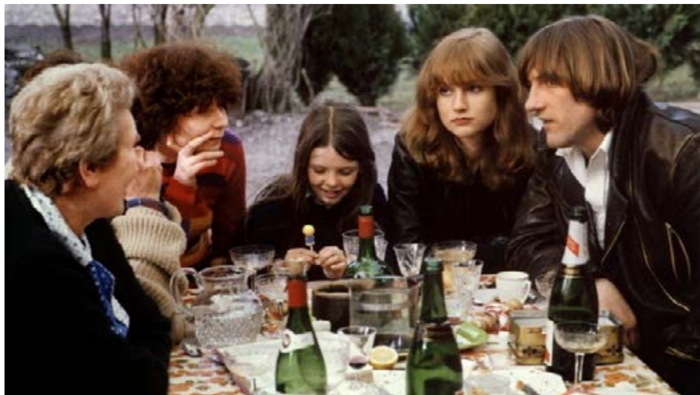
Loulou , 1980

Après toutes ces lectures, j'ai senti la nécessité de rencontrer des personnes intimement liées à Maurice Pialat, qui ont participé au film, ou y ont consacré une part de leur travail. Je voulais leur parler de mon désir d'adapter A nos amours au théâtre, leur soumettre les quelques intuitions que j'avais, et les questionner pour continuer à avancer.