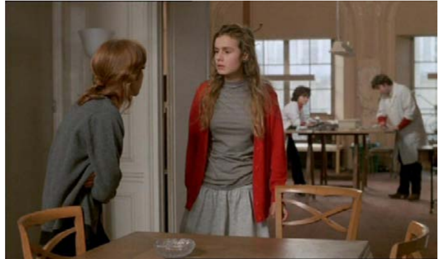
A nos amours, 1983

Sa mise en scène lance la caméra à la poursuite des acteurs , mais elle obéit à des règles strictes : l'organisation spatiale de l'appartement-atelier, qui limite les déplacements dans l'horizontalité comme dans la profondeur et distribue à chacun une place à laquelle il ne cesse d'échapper ; les regards qui, comme les corps, se cherchent et s'évitent.