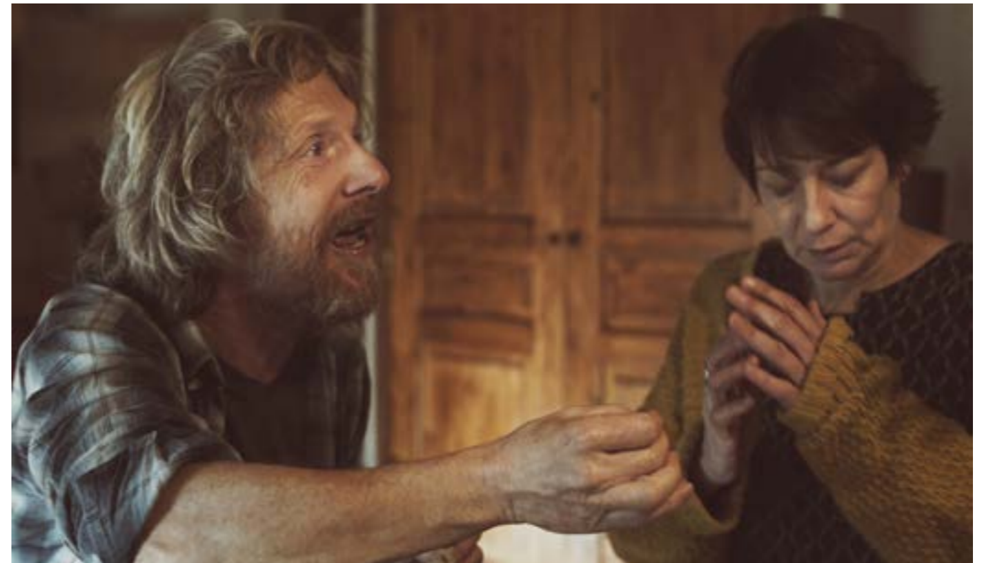
Répétition ANA

Il est mort depuis plus d'un an, c'est un fantôme qui revient au milieu des siens, leur parle, les questionne, mais ils ne l'entendent ni ne le voient. Tout juste peuvent-ils ressentir sa présence.