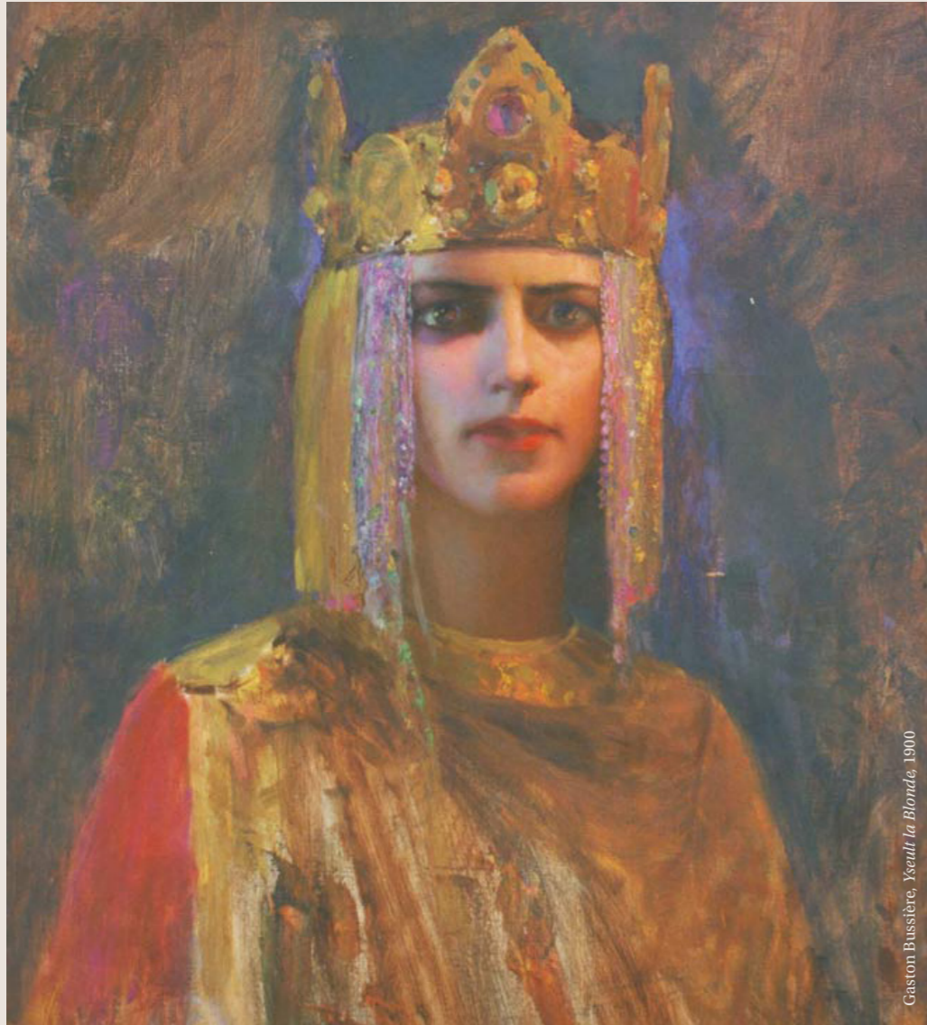
Gaston Bussière, Yseult la Blonde, 1900