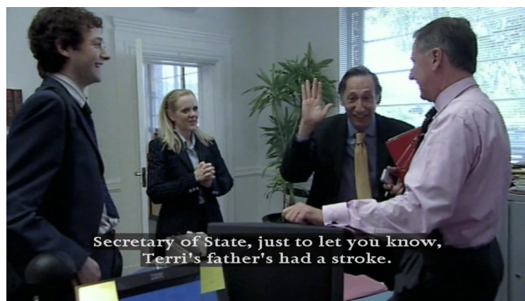
The Thick of it, Armando Iannucci, Saison 1 Épisode 3 : “Monsieur le Ministre, juste pour vous dire, le père de Terri a fait un AVC”

Par ailleurs, dans cette même idée de mélange des genres, nous travaillons à nous approprier la langue de Musset pour la restituer par bribes. Nous souhaitons ainsi mettre en valeur sa puissance évocatrice, qui pourra surgir au milieu d'un langage contemporain, comme l'écume qui coiffe la crête des vagues.