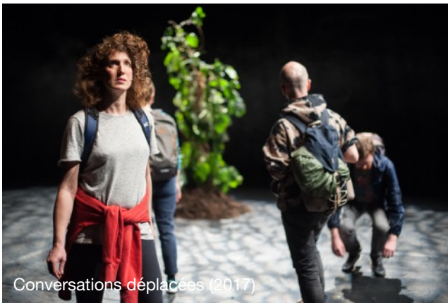
Conversations déplacées (2017)