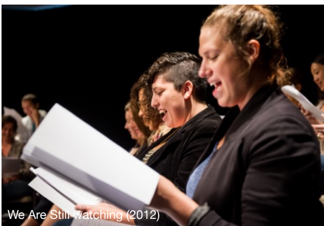
We Are Still watching (2012)