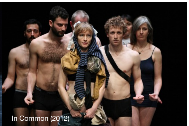
In Common (2012)