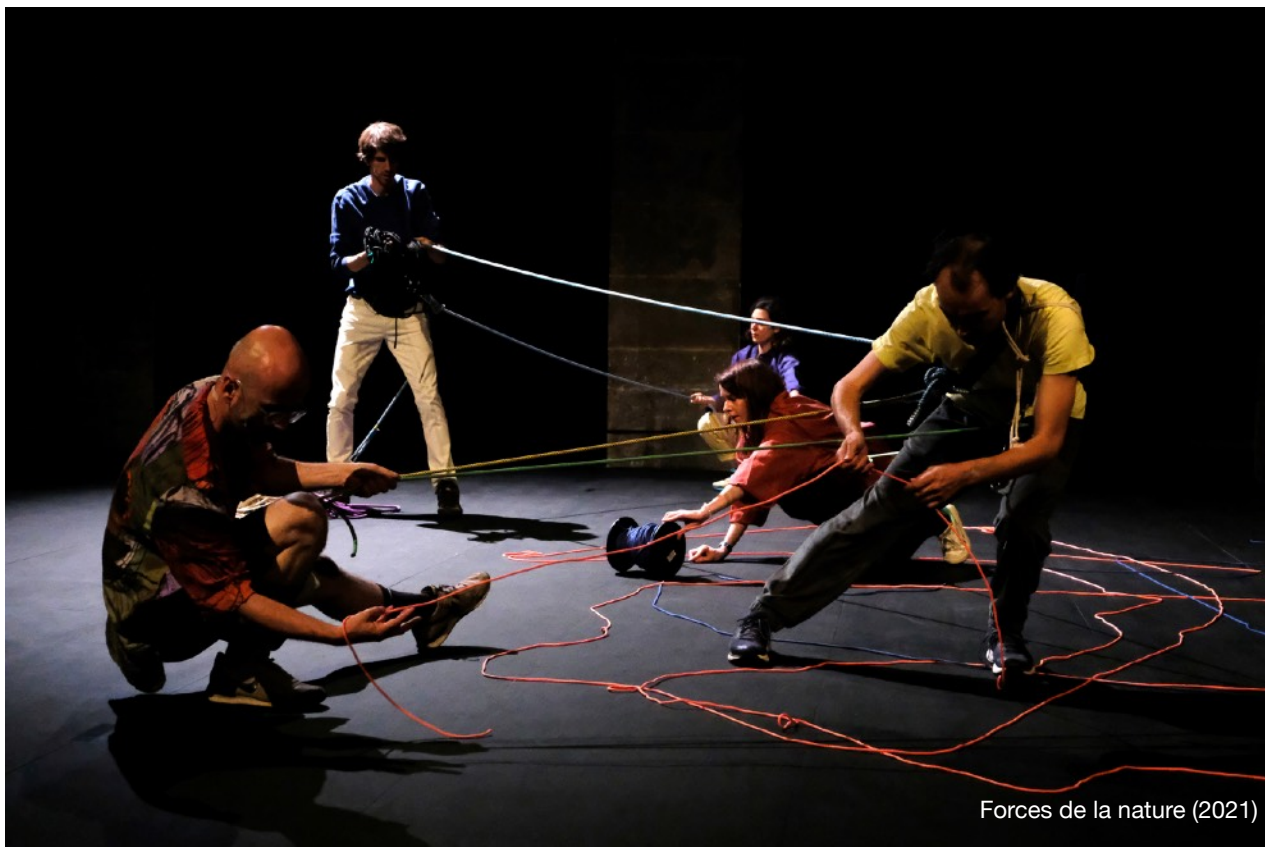
Forces de la nature (2021)