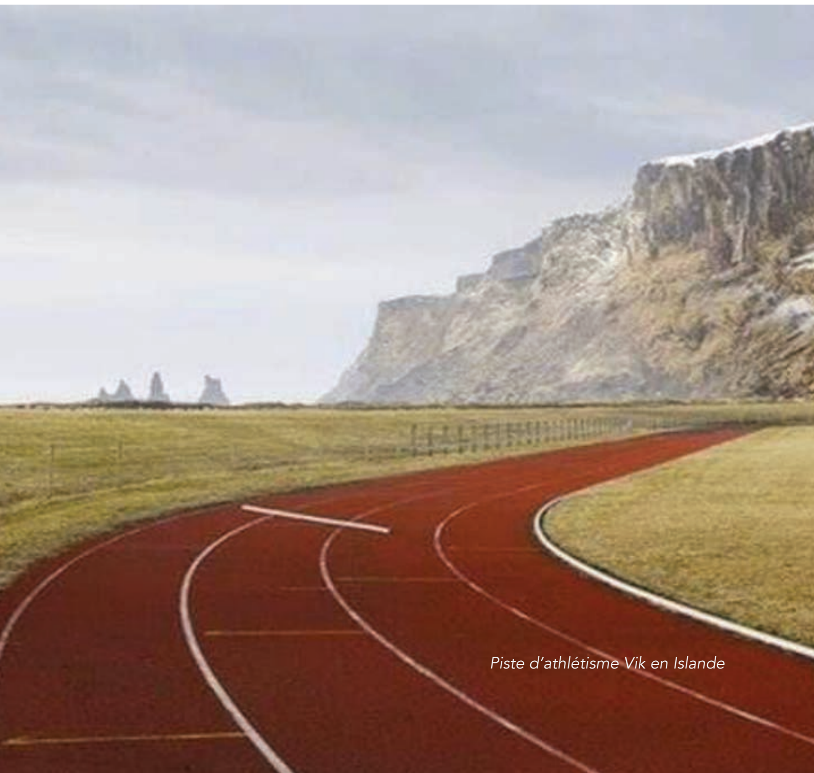
Piste d'athlétisme Vik en Islande