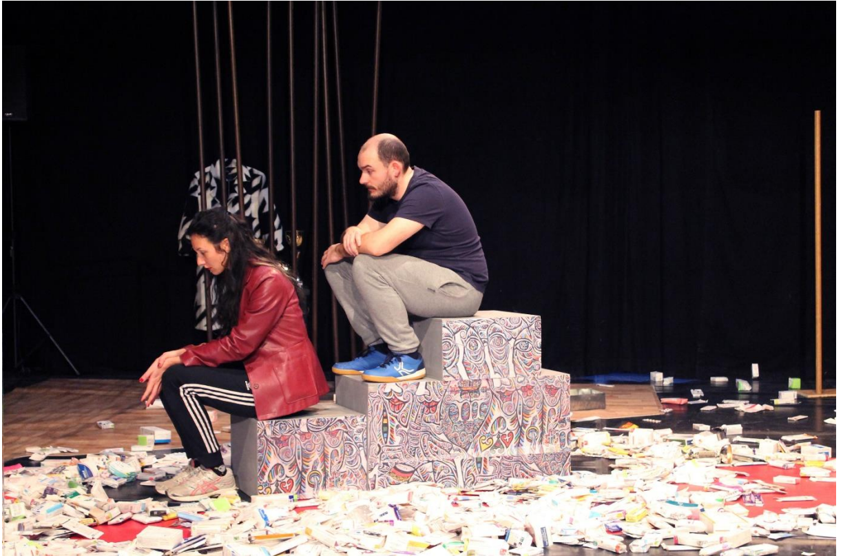
Photo de répétition Nouveau Gare au Théâtre / Janvier 2023

Lilli ne s'épile plus elle dit qu'après c'est pire encore elle a des sautes d'humeur elle espère qu'elle va finir recouverte comme un tapis de tous ces poils pour se cacher devenir invisible ensevelie comme les vestiges d'une civilisation ancienne Lilli dit qu'elle a des douleurs musculaires