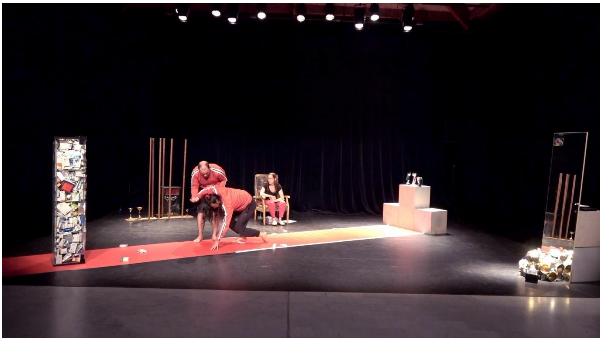
Photo de répétition Centre départemental de Rasteau / juin 2022