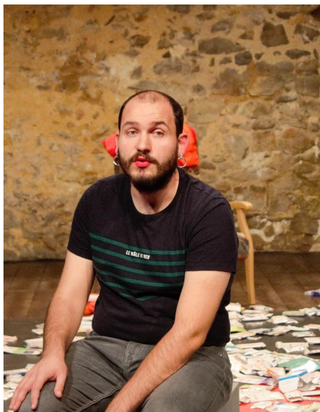
Photo de répétition théâtre de Chaoué octobre 2022