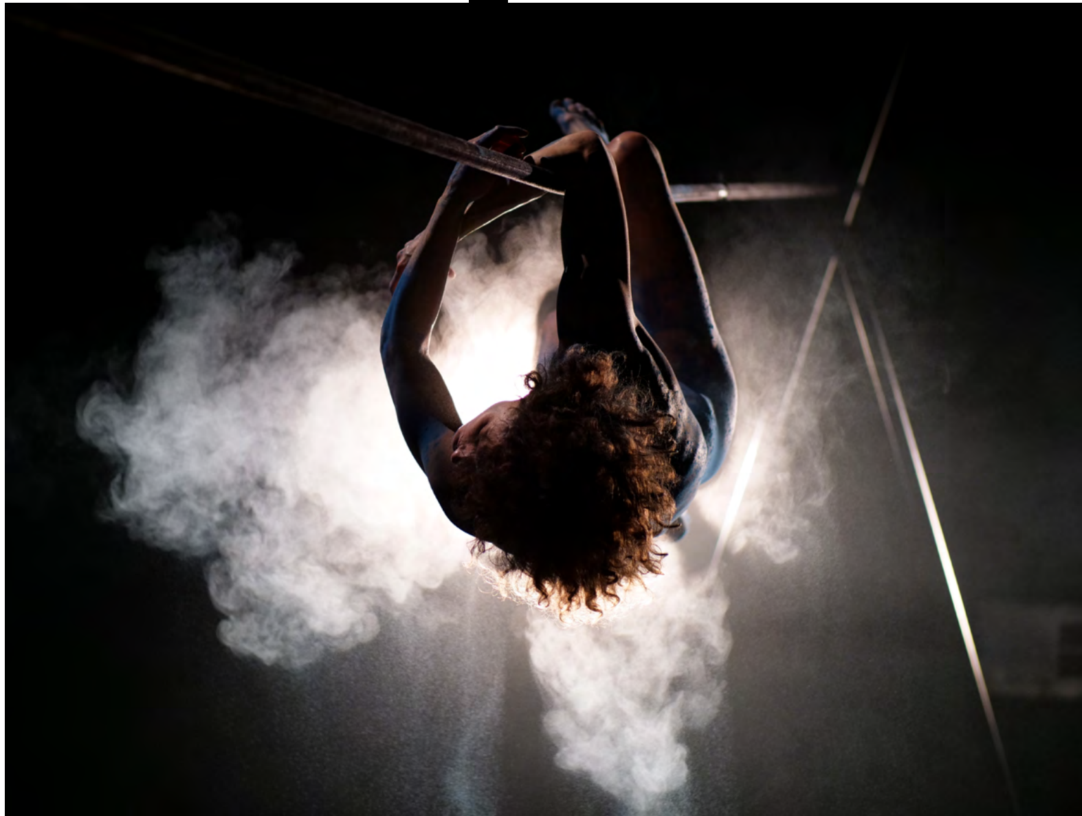
Résidence de recherche - février 2021 - La Machinerie à Homécourt