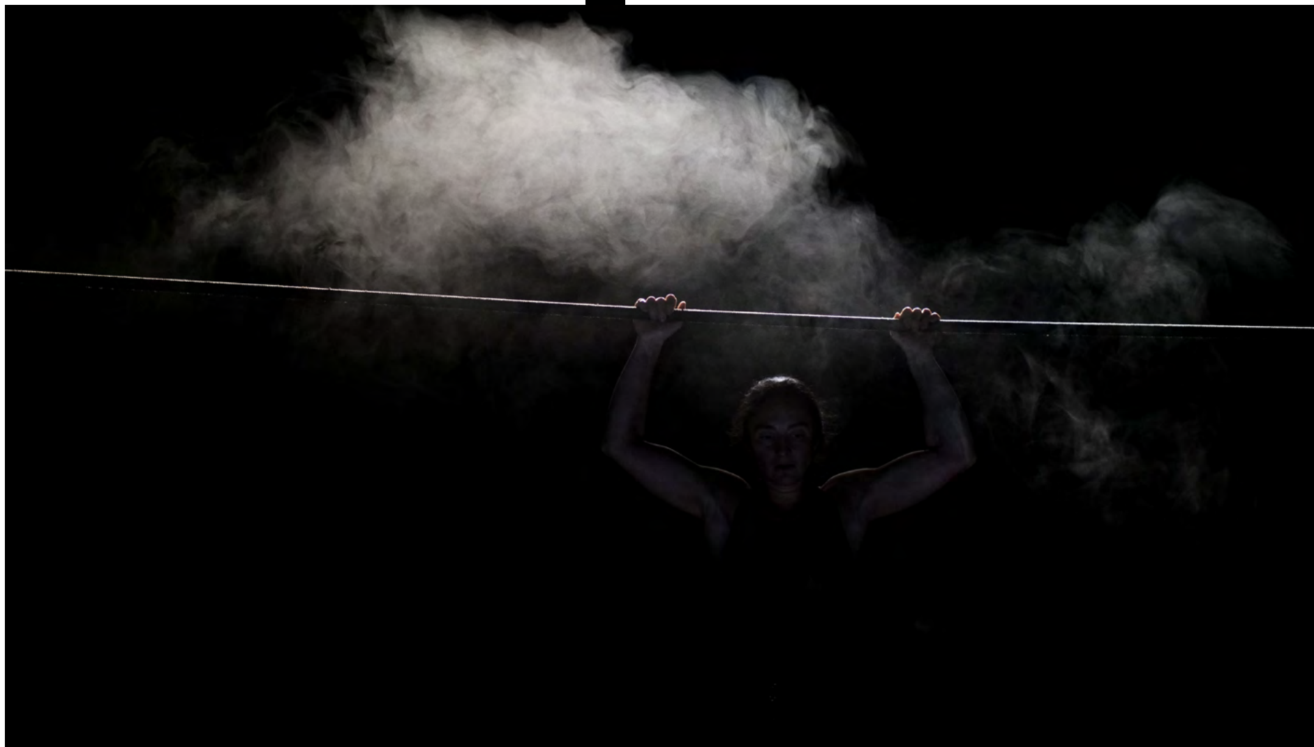
Résidence - octobre 2021 - La Comète, Châlons en Champagne