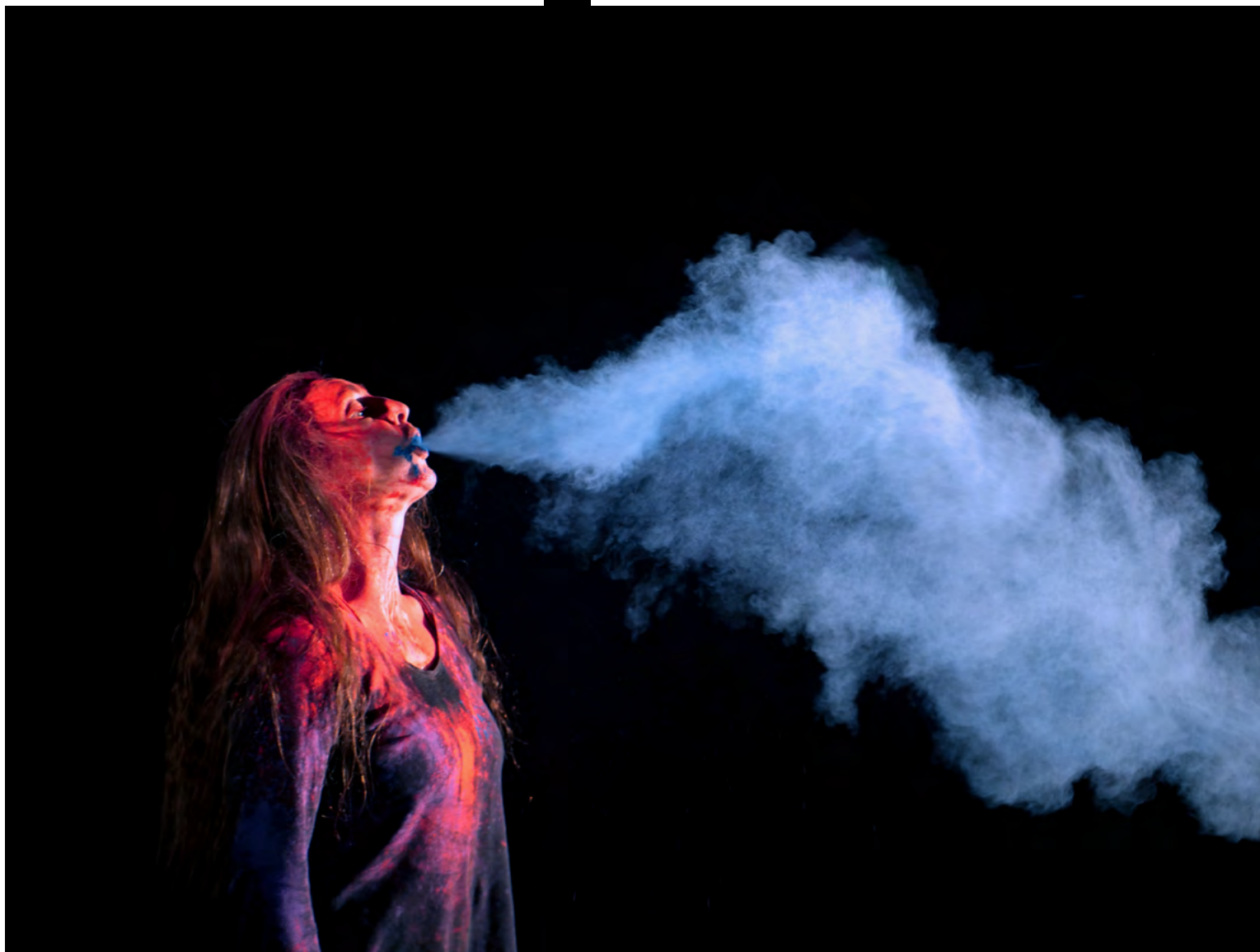
Résidence de recherche - février 2021 - La Machinerie à Homécourt