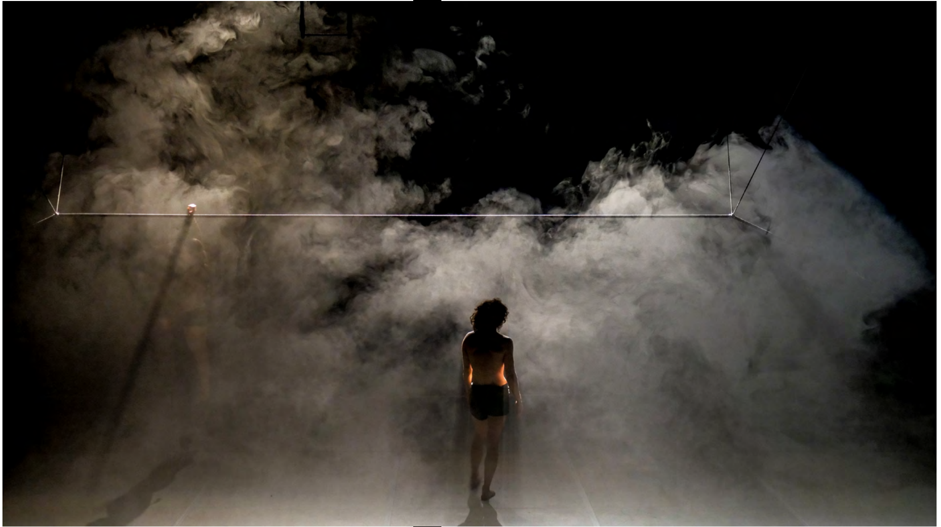
Résidence - octobre 2021 - La Comète, Châlons en Champagne © Vasil Tasevski