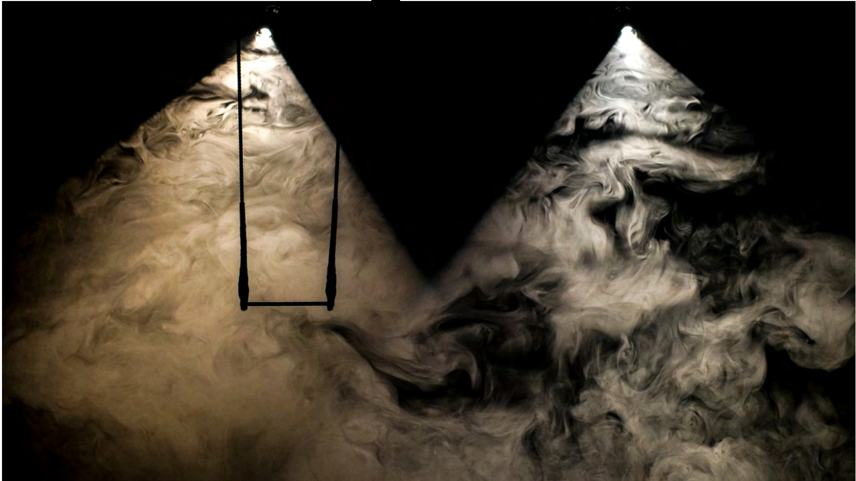
Résidence - octobre 2021 - La Comète, Châlons en Champagne