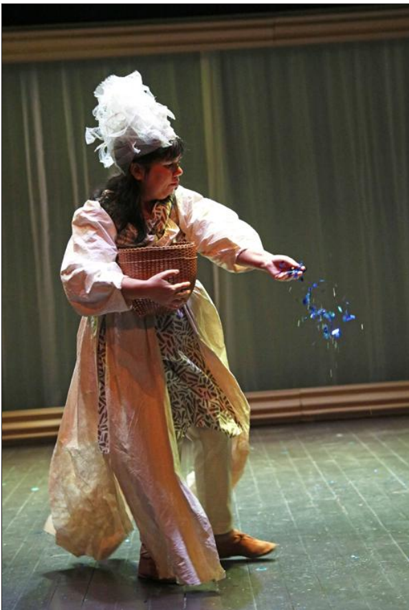
Les fileuses, la porte et le messager, la dernière création poétique du Théâtre de l'Esquisse