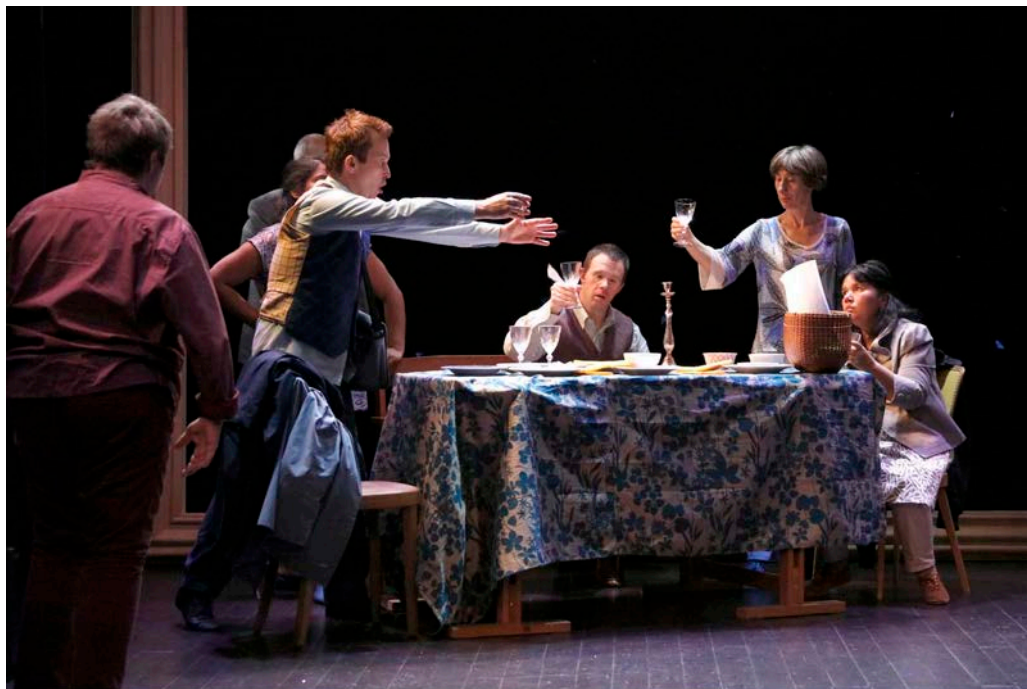
Les dix acteurs des fileuses, la porte et le messager sont en situation de handicap mental.