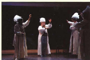
« Les fileuses, la porte et le messenger »