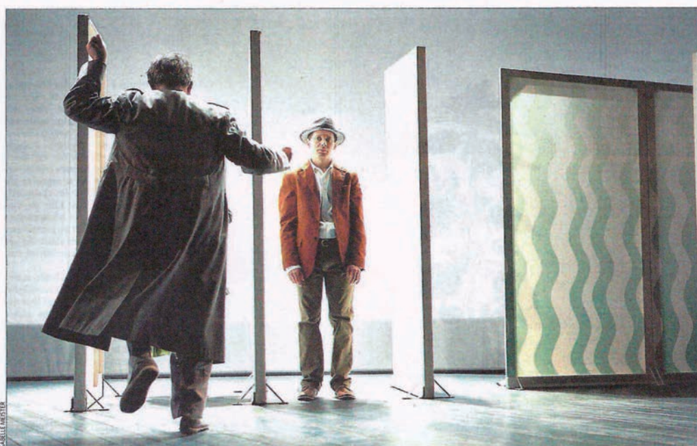
Un voyageur arrive, un autre s'en va. Il en est ainsi dans tous les hôtels. Sauf qu'ici, les échanges sont plus intenses, les images plus poétiques.