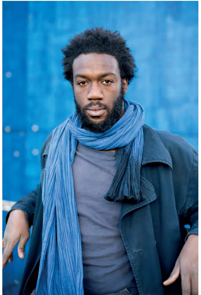
Le comédien Jean-Christophe Folly sera seul en scène dans La nuit juste avant les forêts