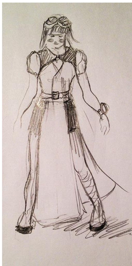
Croquis Costume Princesse Stëlla - Alice Touvet