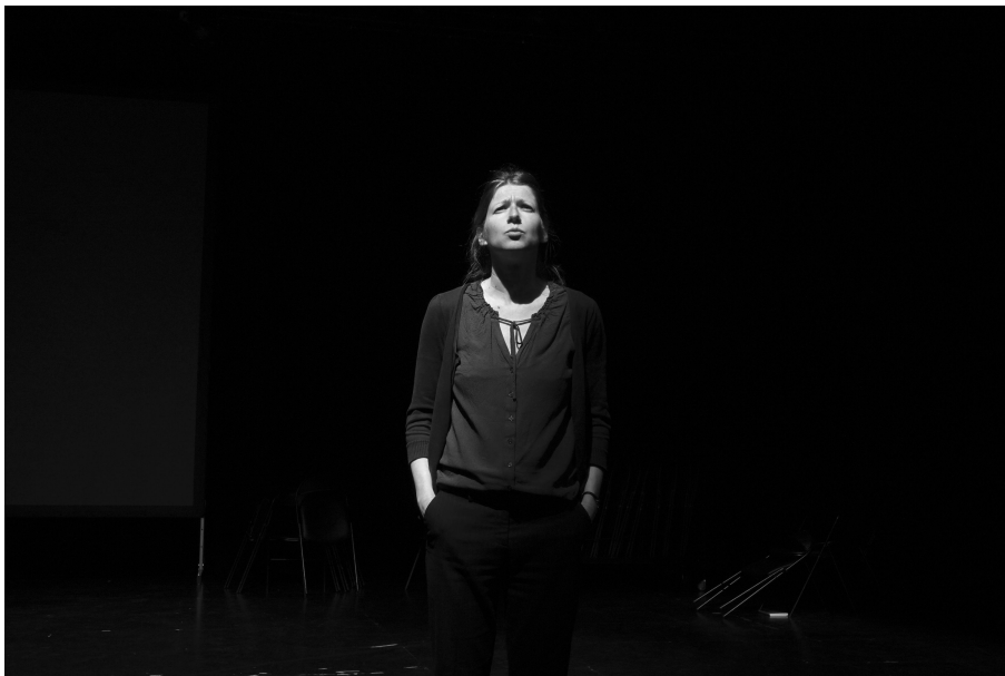
© Béatrice Le Grand - Gwenola Lefeuvre, Résidence à Guy Ropartz, Rennes, mars 2018

Cécile propose ainsi une galerie remarquable de personnages fictifs, inventés, inspirés par les témoignages recueils.