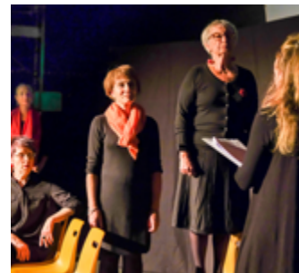
MJC-Centre social, Thoissey (2018)

Présentation du travail effectué lors des ateliers.