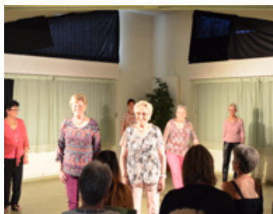
Club des Aînés de la Reyssouze, Bourg-en-Bresse (2018)

Autour de la thématique de la vieillesse.