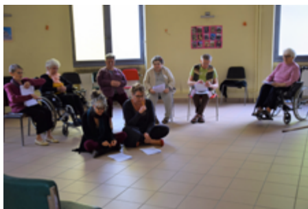
Résidence Émile Pélicand, Bourg-en-Bresse (2018)

Mise en scène et mise en voix des écrits réalisés.