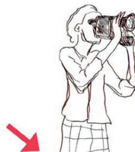
Solange Dulac mène l'enquête