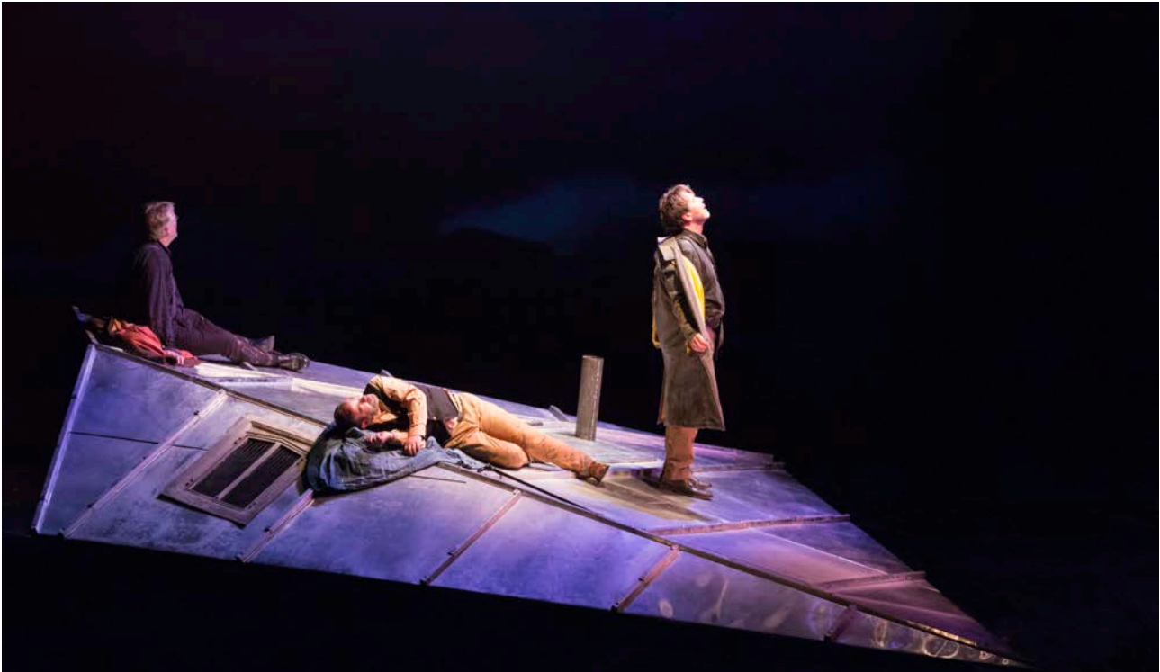
Trois hommes sur un toit (2017)

Un spectacle naît de la rencontre d'un auteur dramatique et d'un auteur scénique ; d'un texte et d'un metteur en scène. Les spectacles produits prennent appui sur des formes esthétiques différentes liées au point de vue et à l'univers du metteur en scène, associant des disciplines telles que la chanson, la danse, la vidéo, la musique.