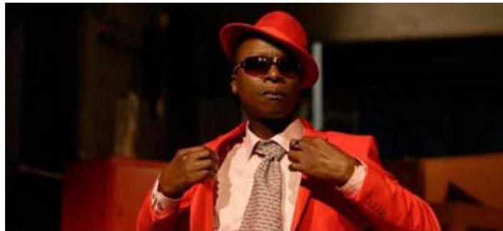
Cette histoire d'impasse collective devient une exploration chorale des bassesses de l'âme humaine.