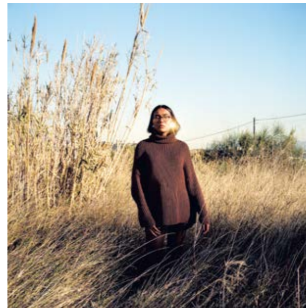
Photographies : Zoé, Marseille, 2019 Commissariat d'exposition : Floriane Doury

Yohanne Lamoulère se confronte à une série de photographies, où les corps semblent mentir, tout autant que les paysages. Ce corps qui renvoie à l'espace politique de la ville est tout proche, solaire, mais aussi cruel. La photographe nous parle de désir, de sa propre trajectoire et de ses nouvelles images : « Elles seront classiques, dans la veine de la photographie naturaliste que j'aime tant. Je vous donne quelques pistes : les gravats, les trains, la nationale 113, les roseaux, la méditerranée, jaune, décembre 1993. C'est une fiction. »