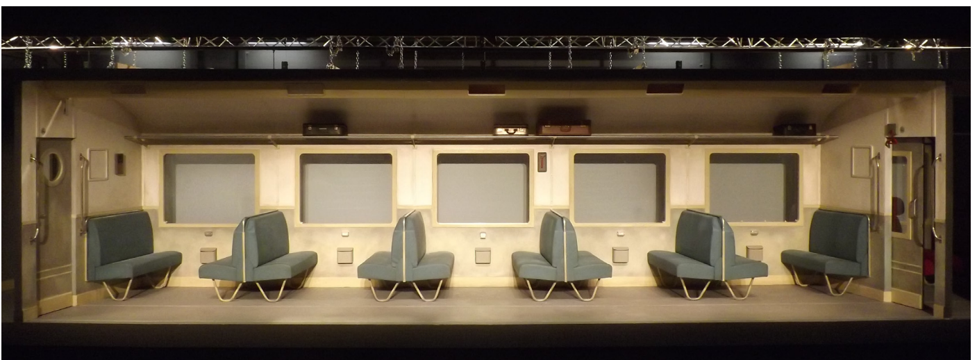
Photo de la scénographie du Remplaçant