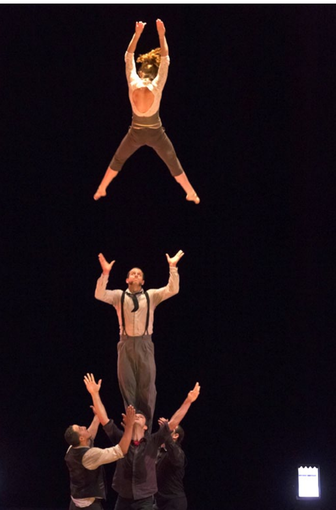
1 et 2 : © Christophe Raynaud de Lage