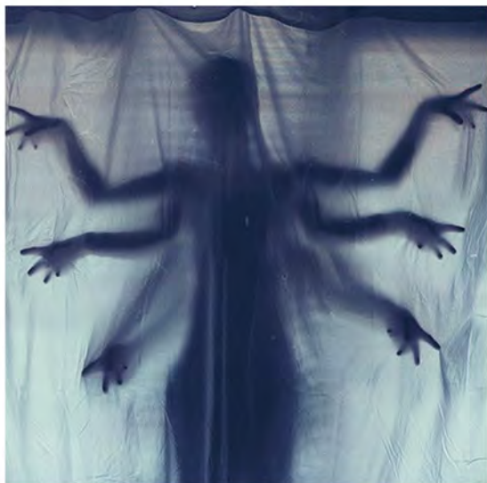
Tranparences / ombres chinoises