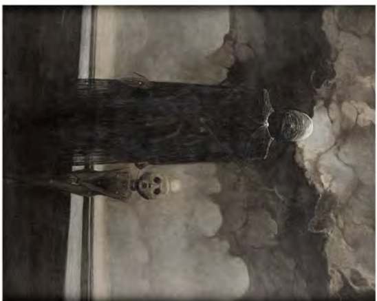
Proportions Personnages films / marionettes