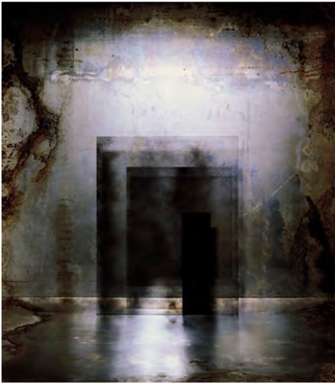
AduC - scénographie

Panneaux / écrans mobiles / tulles / pepperscrim miroirs / transparence / flou / fumée Coulours de lumiere / projections de textures animées Espace protéiforme / architecture / brouillage