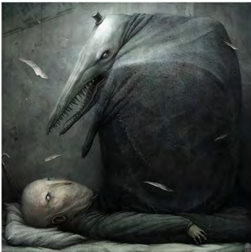
Lit / miroir / füssli effect