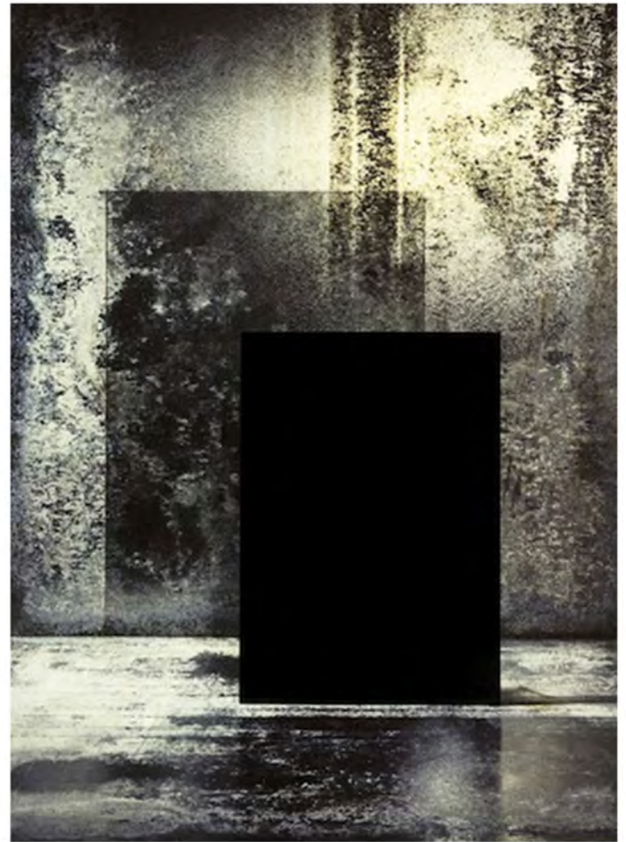
PVC transparent matière sali / vernis flou

Panneaux / écrans mobiles / tulles / pepperscrim miroirs / transparence / flou / fumée Coulours de lumiere / projections de textures animées Espace protéiforme / architecture / brouillage