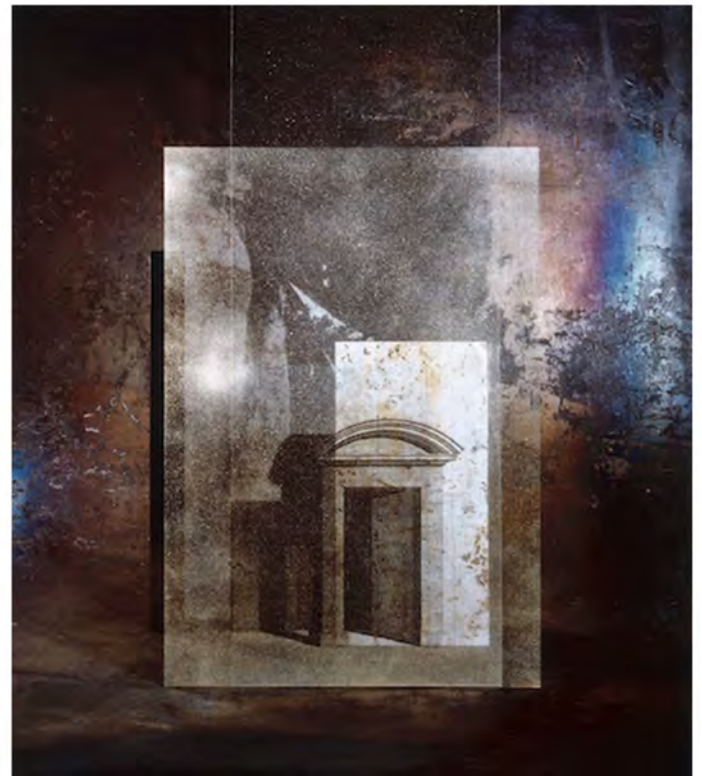
Superposition de transparences matériau + images projetées