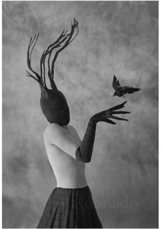
Costumes et Masks