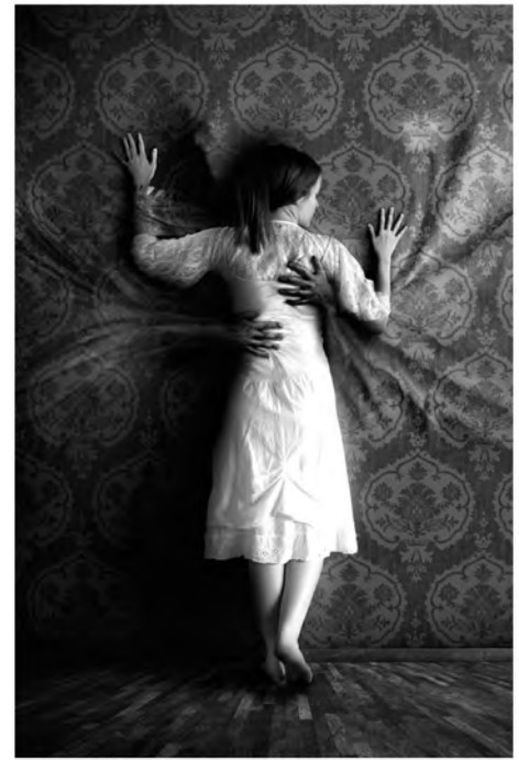
Antichambre chambre Sleep paralysis