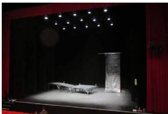
© DR - photos de répétitions