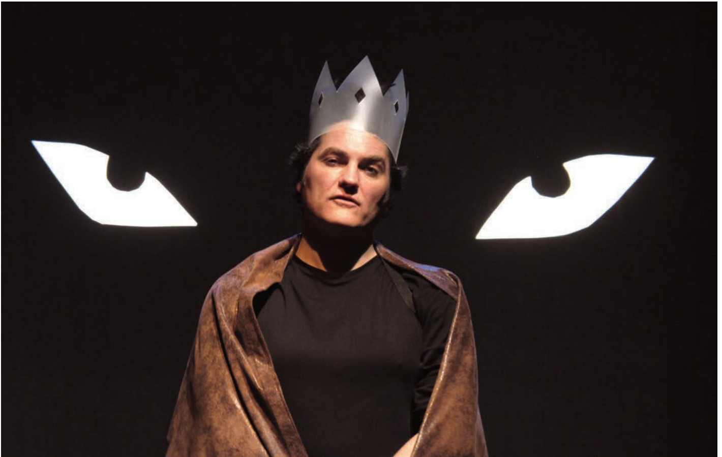
Benoît Piel © Sophie Piegelin

« La peur se nourrit de la peur. On ne devient loup que dans le regard de l'autre. Le loup ne sait pas qu'il est un loup avant d'avoir vu un homme fuir à son approche. Le temps est fini pour toi de vivre parmi eux. (...) Si tu te regardes dans mes yeux, tu y verras encore un homme. Regarde et souviens-toi. » La vieille nourrice