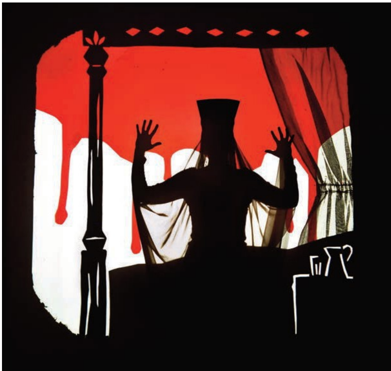
Elisabeth Urlic

(94) pour créer la scénographie du spectacle Vive Nous basé sur des témoignages de femmes des cités.