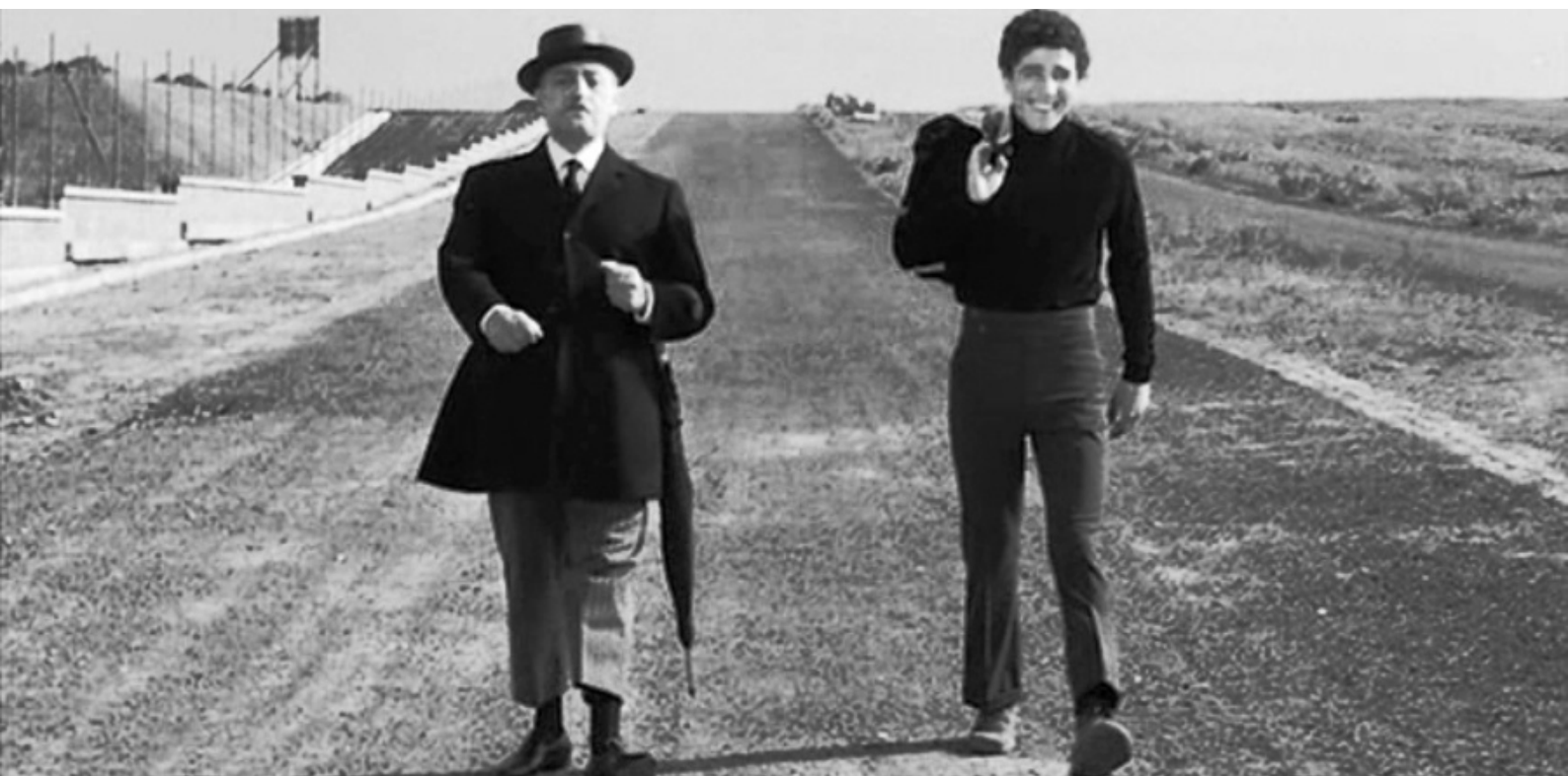
Image extraite du film Des Oiseaux petits et gros (Uccellacci e Uccellini) . Réalisé par Pier Paolo Pasolini, 1965

Extraits d'un entretien entre Catherine Marnas et Hervé Pons, avril 2017