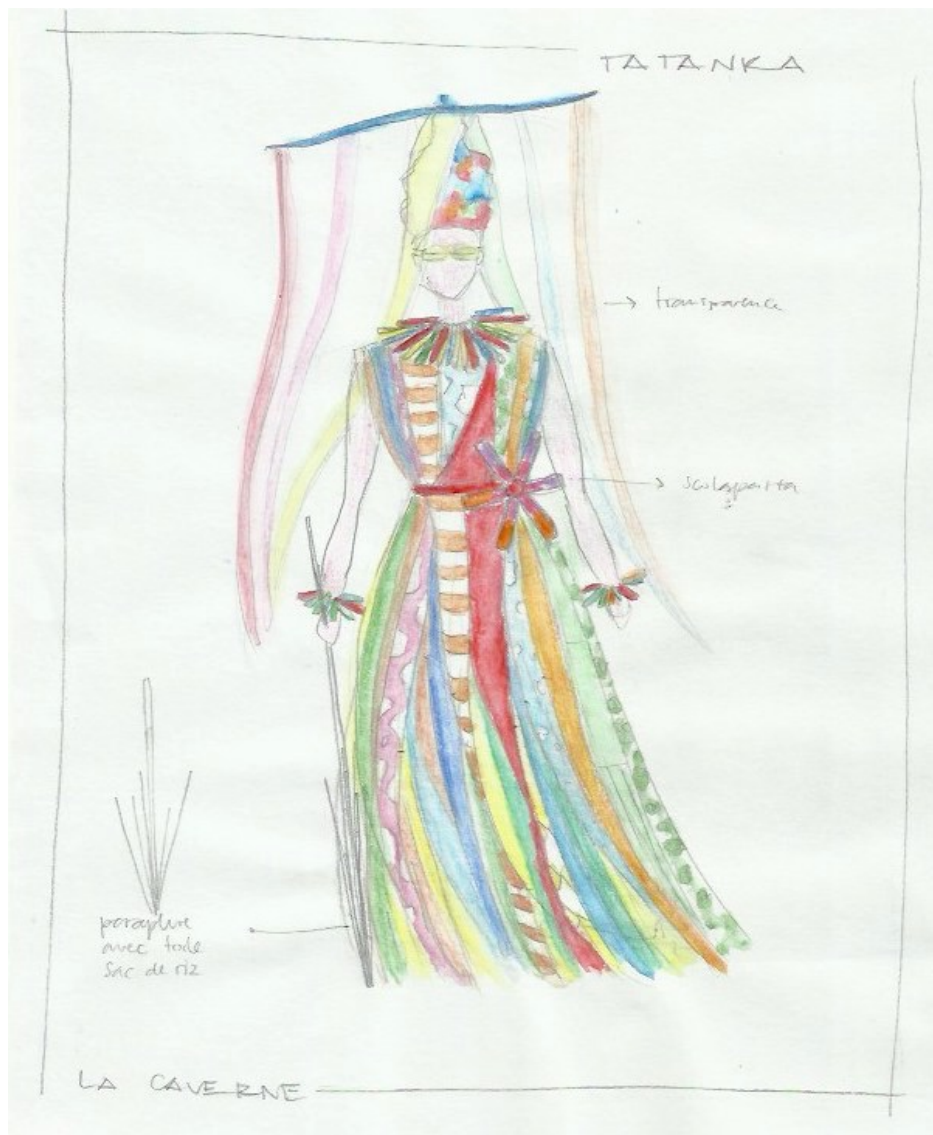
Dessin du costume de Tatanka réalisé par Marta Rossi

A la différence des souterrains ils ont réussi à inverser le rapport de force qui d'ordinaire lie l'homme et l'objet dans une société de consommation ; ils sont parvenus à s'affranchir des standards qui jadis avaient colonisé l'imaginaire des hommes. Comme le fait le lapin dans Alice aux pays des Merveilles Tatanka guide Manon vers un autre monde, une autre réalité, l'invitant ainsi à remettre en cause le sens de son existence.