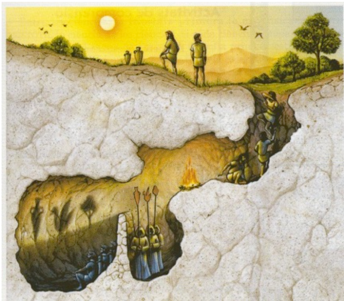
L'allégorie de la caverne

Manon partage son dilemme avec les spectateurs : doit-elle annoncer aux souterrains que la vie est de nouveau possible en dehors de la Caverne, au risque qu'ils regagnent la surface et reproduisent les erreurs commises 500 ans plus tôt ? tout d'annoncer aux habitants de la Caverne que la vie à la surface est possible mais, à sa grande surprise, ils refusent de la croire.