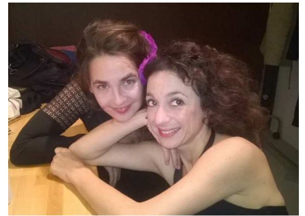
TAMAO en répétitions à la Norville le 02/11/2016