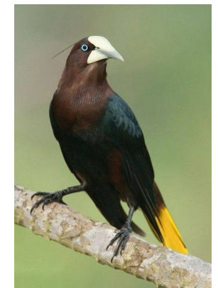
Cassique à crête