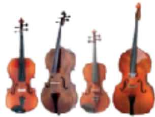
a - le quatuor à cordes