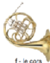
f - le cors