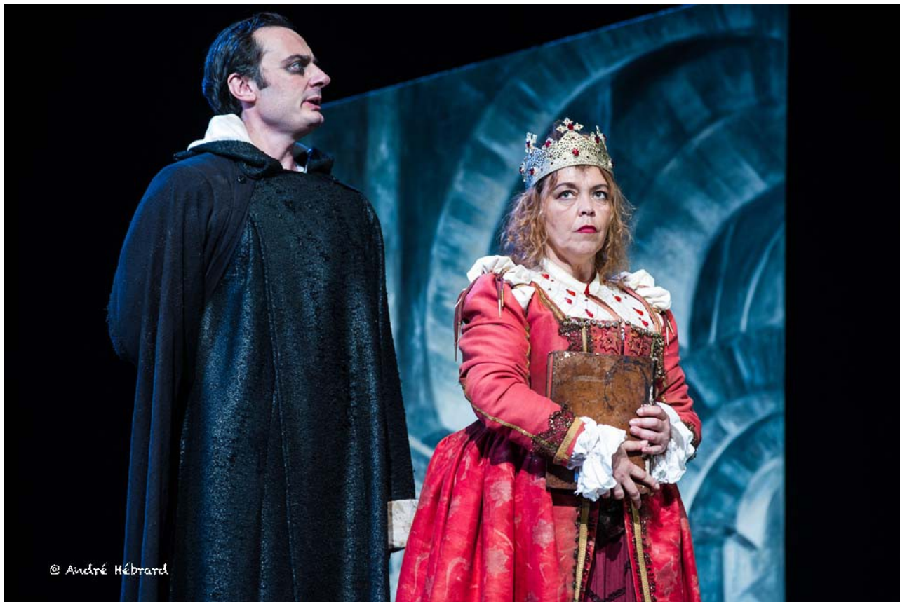
La reine Isabelle et Torquemada