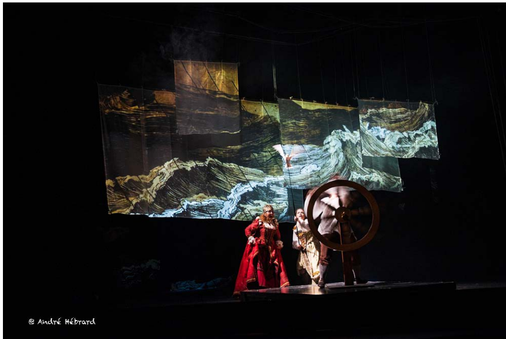
La caraque Santa Maria de Christophe Colomb

C'est l'ambiguïté de ces époques que nous voulons creuser, avec un amour sincère pour la passion sans borne qui guide tous les personnages que nous rencontrons ; une passion vitale dans notre conception du théâtre : un théâtre total, où l'espace de nos projections ne rencontre plus d'obstacle. C'est ainsi que se déploie toute une esthétique de la manipulation, impressionnante machinerie de navires dont les ficelles sont tirées à vue par les personnages, mus par le désir du voyage collectif.