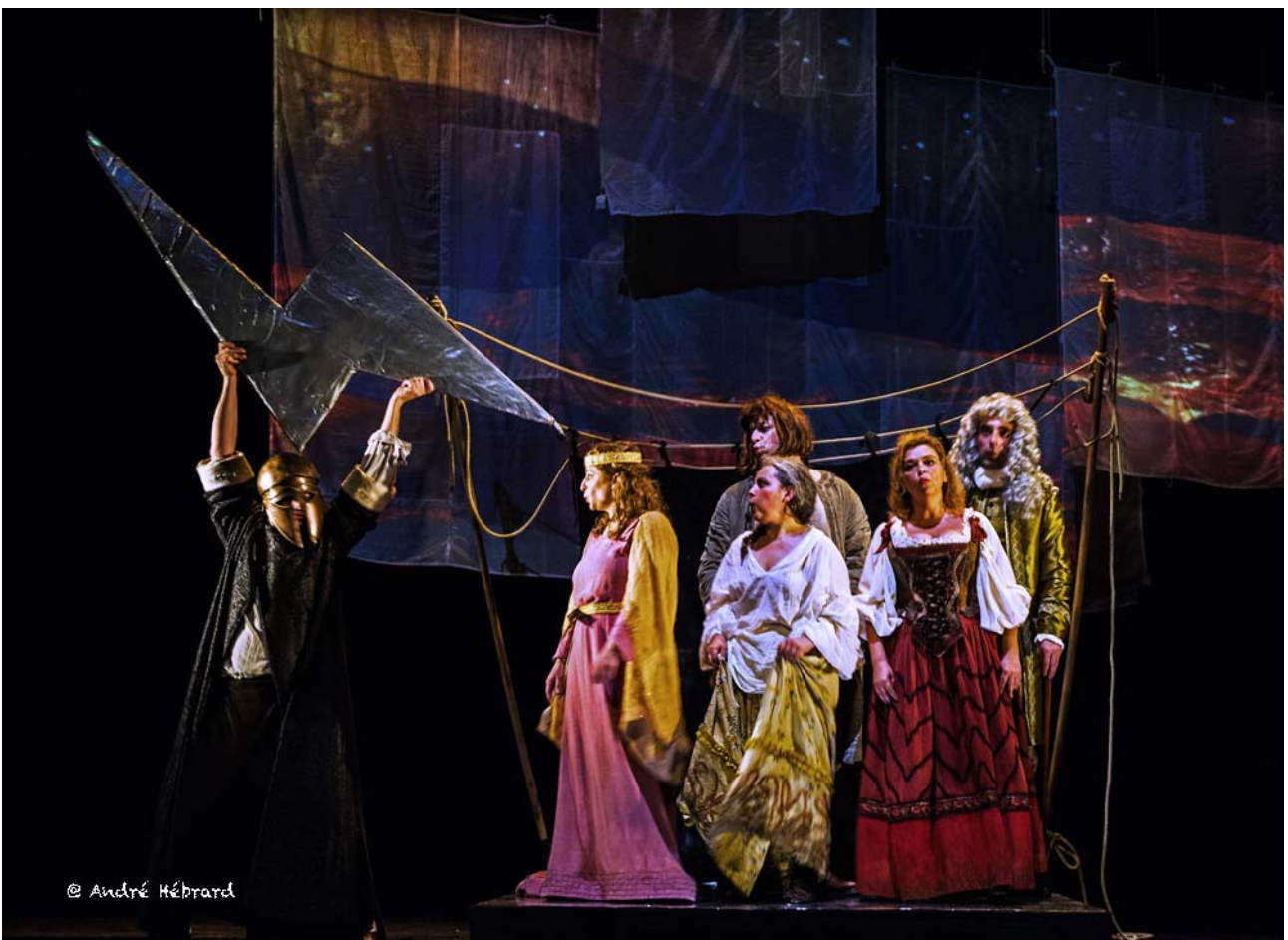
Pluton menaçant le Radis Couronné