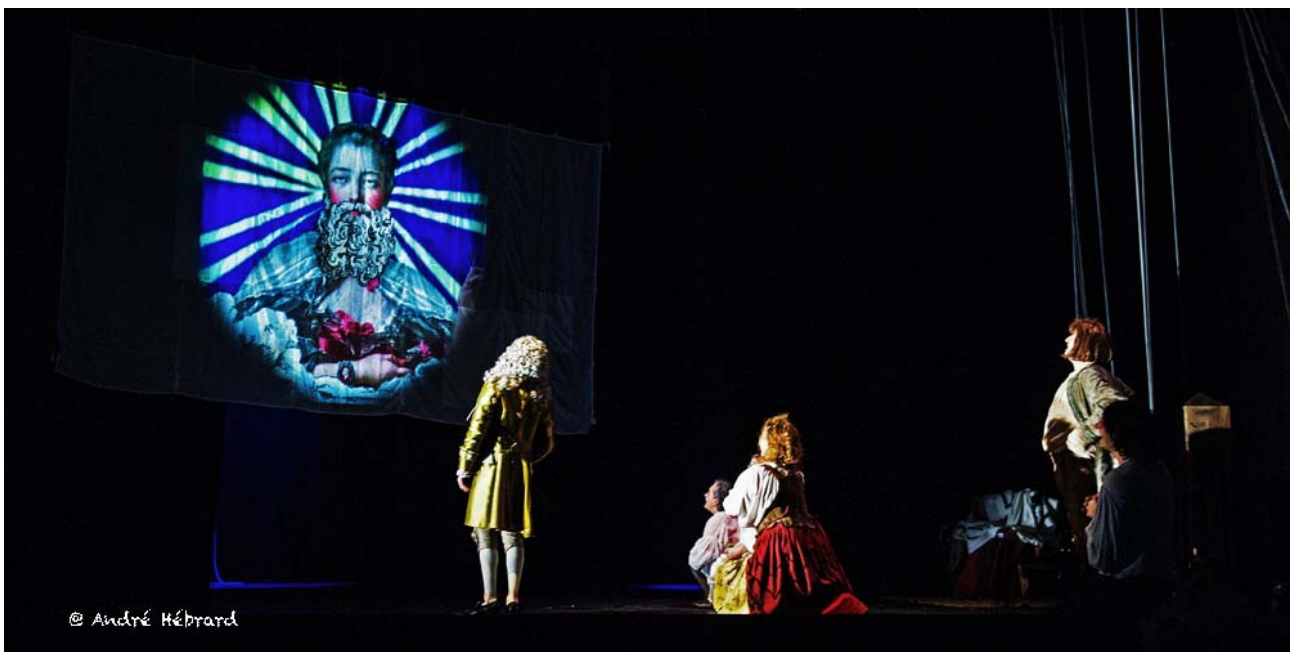
Dieu apparaît au Radis Couronné