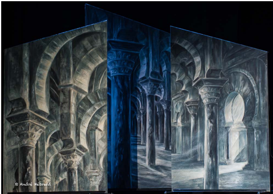
Toiles peintes – Le palais de l'Alhambra

La vision scénographique principale s'est nourrie de la richesse des gravures de Gustave Doré, célèbre illustrateur, graveur, peintre du XIXe siècle et du montage des scénographies de Georges Méliès.