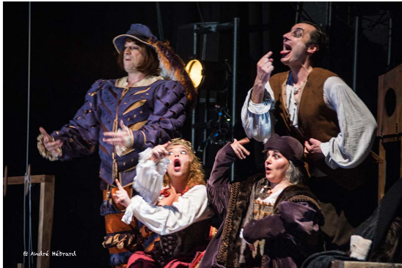
La troupe du Radis Couronné