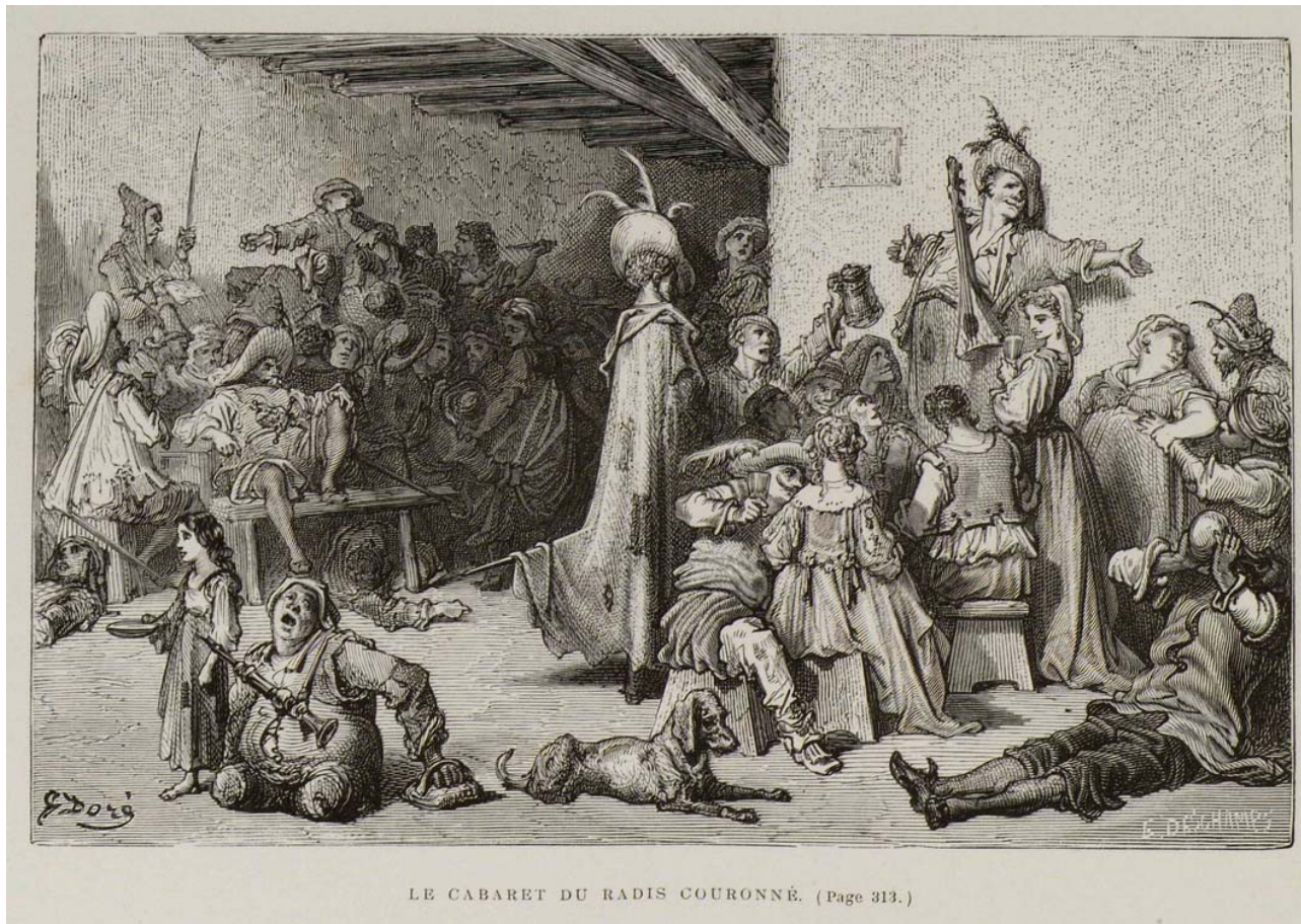
Le cabaret du Radis Couronné (Le capitaine Fracasse) – Gustave Doré

En référence au cabaret du même nom dans Le Capitaine Fracasse de Théophile Gautier