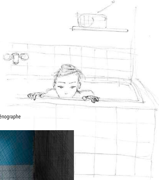
Premiers dessins d'Amandine Livet, scénographe