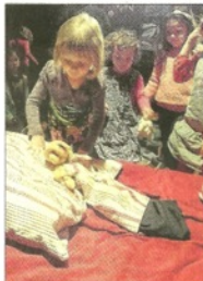
Les petits spectateurs ont fait un bisou à la marionnette, à la fin du spectacle.