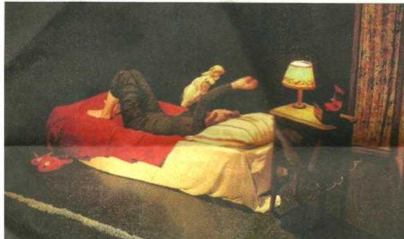
Drôle, tendre et burlesque, le spectacle « Tu dors (Bagatelle #1) » est rejoué ce mercredi à 10 h 30 et 11 h 30 au foyer Saint-Maurice de Pfstatt.

Mais c'est là qu'une marionnette en chiffon entre en scène. Semblant surgir du corps endormi, elle commence à articuler ses jambes et ses bras... à ses risques et périls. Les enfants s'esclaffent. « C'est très drôle, confirme Tom, 7 ans et