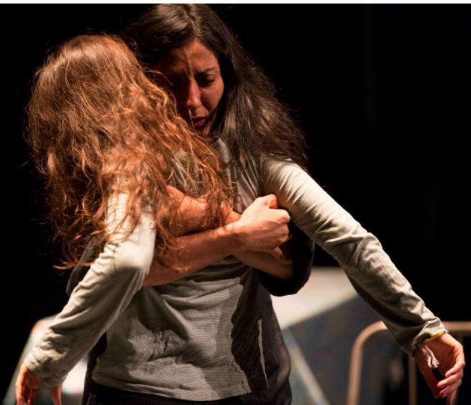
Roberto Zucco de Bernard-Marie Koltès - mise en scène Richard Brunel

Roberto Succo , le film de Cédric Khan (2001) déjoue les codes du thriller tout en jouant sur ses grands principes : road movie , courses poursuites, engrenages de faits mais sans démonstration des causes et des effets. Le scénario fait donc le pari de tenir la ligne de l'absence de mobiles au risque de donner au récit un certain manque de cohérence dans les agissements du personnage principal. Le scénario suit bien le principe d'un thriller mais les liens entre les personnages, les agressions ne se font pas. Le choix d'un point de vue externe place le spectateur hors de la logique de Succo . Au-delà du thriller, le film cherche donc plus son unité dans la rencontre entre le biopic et le portrait.