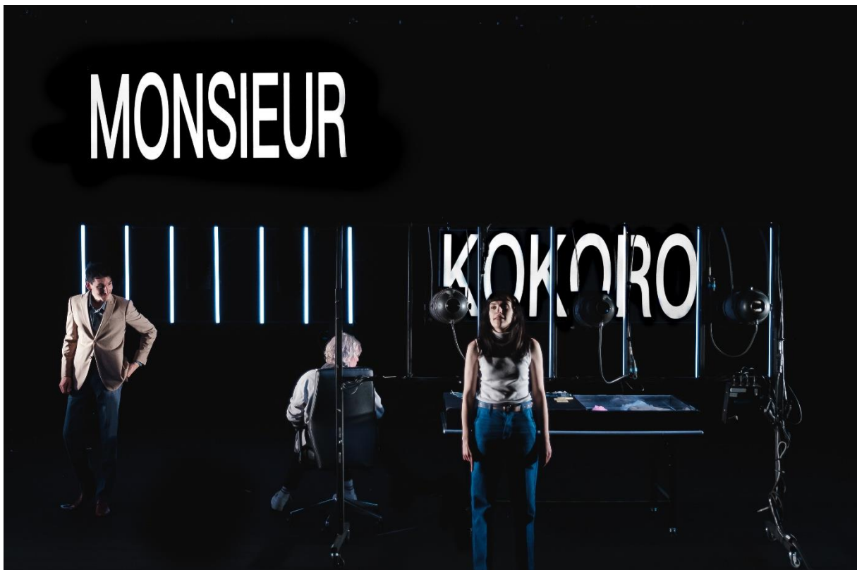
Rabudôru, poupée d'amour

Sur son territoire, la compagnie déploie une partie de son projet, à Caen, au sein d'un lieu dédié à la formation et à la jeune création : « le 28 ».