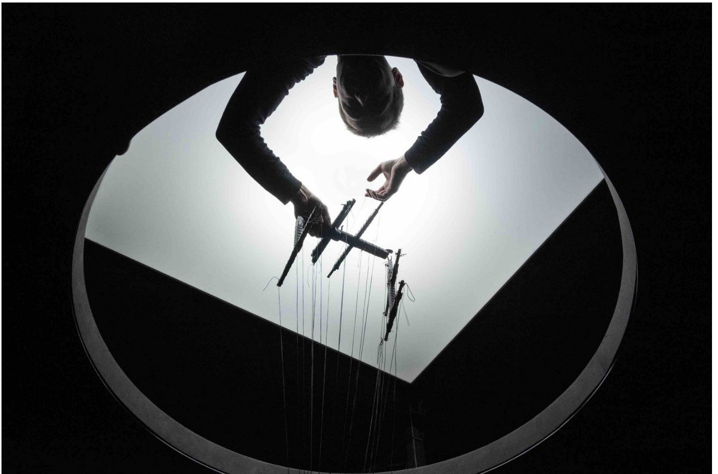
Milieu, Renaud Herbin