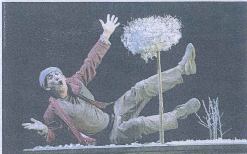
Un spectacle plein de fraîcheur.

Comme un grand frère sur qui l'on peut toujours compter, le