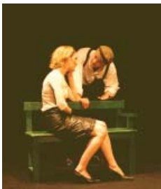
Manuel à Usage des Amoureux

de la Chorale à L'Opéra (Opéra et musique classique par la chorale), du Tableau à l'Image (Histoire de l'art par mise en scène et photographie), du Tableau à la Scène (langage de l'image par l'écriture et le théâtre), Il était une fois le Conte (découverte du patrimoine locale et écriture de conte).