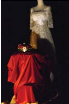
Moi, le violon

La culture rassemble les individus dans ce qu'ils ont de commun : un héritage qui constitue notre mémoire collective, socle de l'identité d'un peuple.