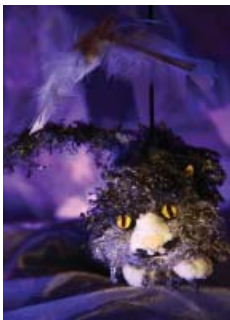
La Princesse sans Sommeil

Il y a eu Manuel à Usage des Amoureux , Sur les Chemins Magiques de La Fontaine , Contes Zé légendes (série théâtrale - 5 opus), la Princesse sans Sommeil , GAMME D'AMOUR (récital d'airs de Tosti en guitare ou piano voix), Moi, Le Violon , et prochainement Hansel et Gretel et Phèdre .