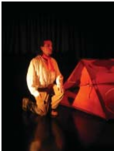
Contes Zé Légendes...

Nous imaginons également des ateliers pédagogiques originaux pour tous les publics, motivés par les mêmes ambitions.