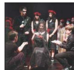
Perséphone Opéra pOp