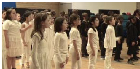
le Roi du Jazz