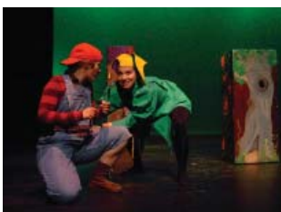
Sur les Chemins Magiques de La Fontaine