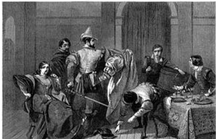
The Taming of the Shrew (La Mégère apprivoisée), by C. R. Leslie

Dans la mise en scène de Frédérique Laza- rini, l'histoire se noue autour d'un cinéma ambulante sur la place d'un village, dans les années 50 en Italie. L'intrigue se déroule sur la scène et à l'écran pour cette mise en abyme chère à Shakespeare, où chacun joue son rôle dans une vie qui a tout d'une fiction et d'un grand théâtre.