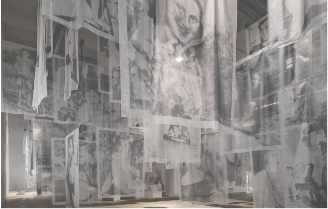
Christian Boltanski, Les voiles , 2013.