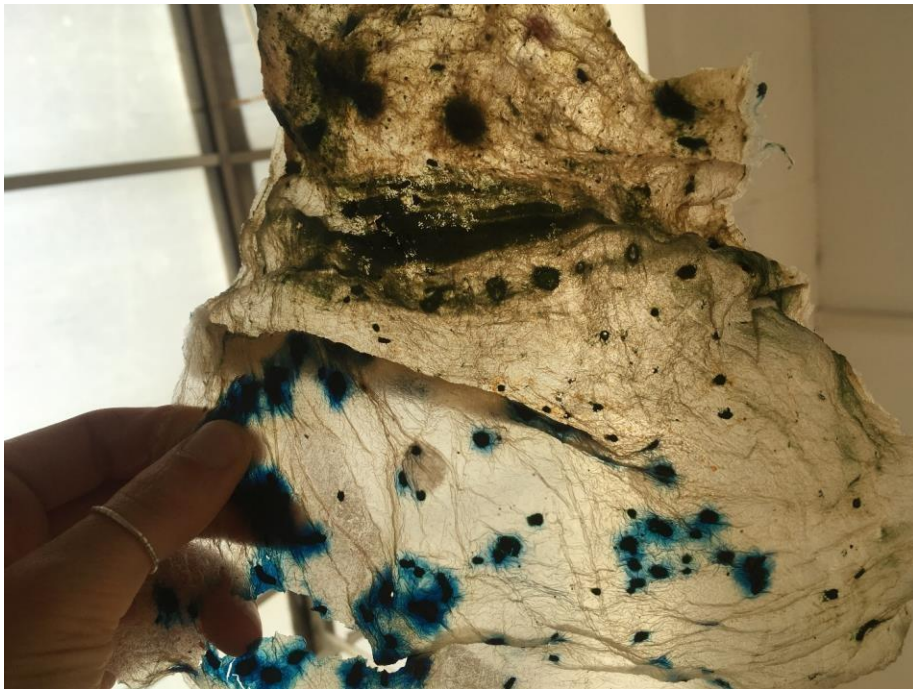
Recherches de textures : agar agar, glycérine végétale et pigments naturels, Charlotte Gauthier Van Tour.