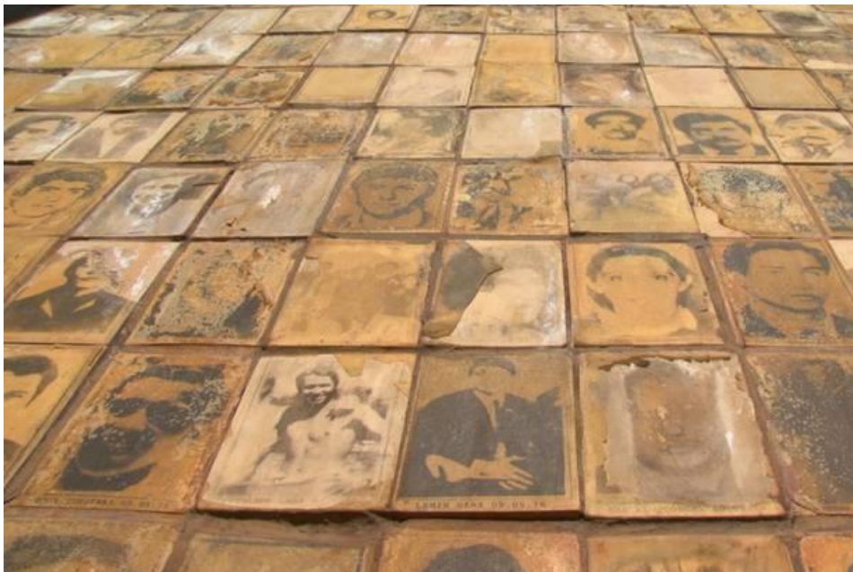
Image du film Nostalgie de la lumière , Patrice Guzman. Les oubliés de la dictature chilienne dans le désert de l'Atacama